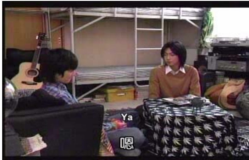
Gambar 20 subbab 3.5