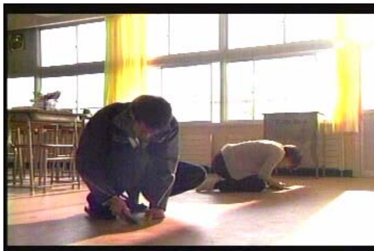
Gambar 6 Subbab 3:2