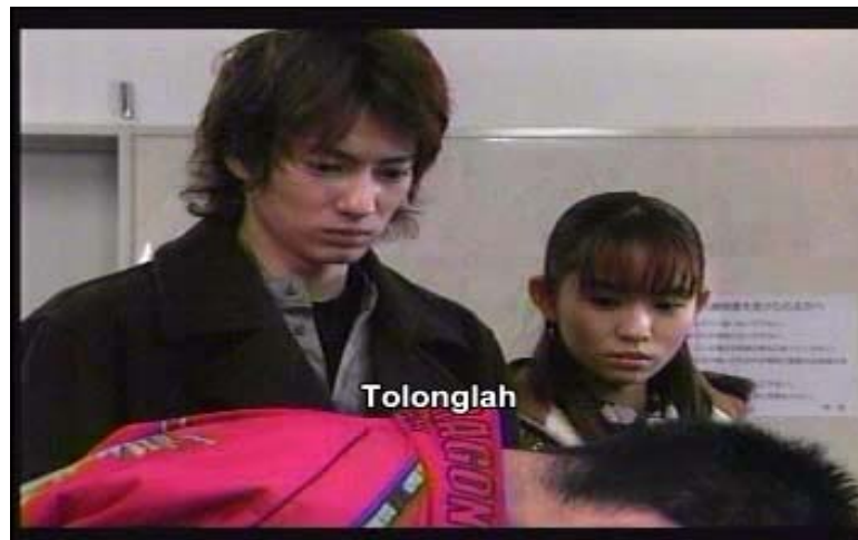
Gambar 14 subbab 3.4