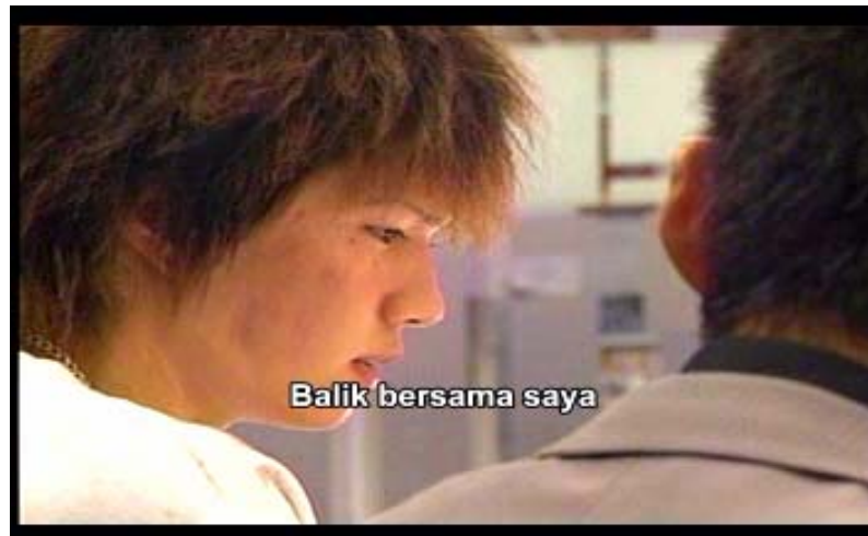
Gambar 12 subbab 3.3