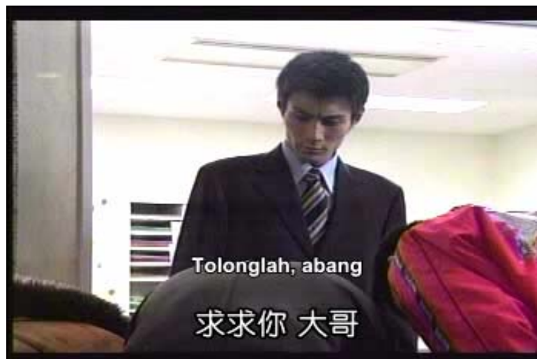
Gambar 15 subbab 3.4