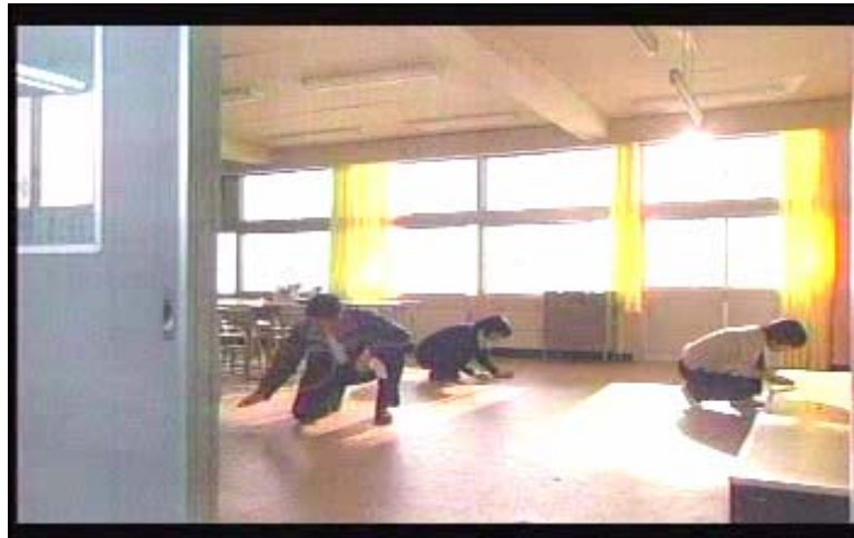
Gambar 5 subbab 3.2