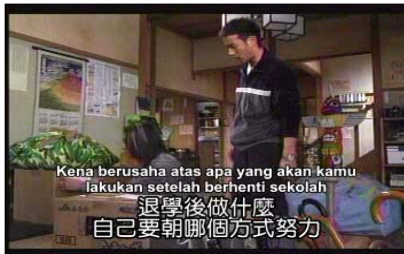
Gambar 19 subbab 3.5