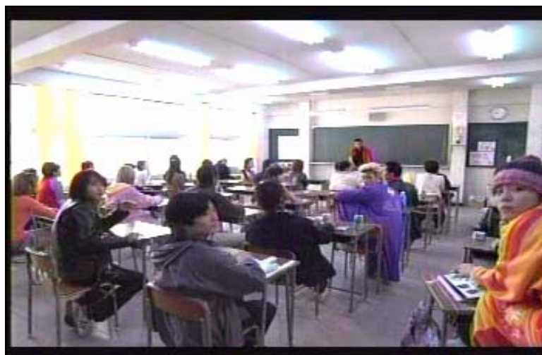
Gambar 21 subbab 3.5