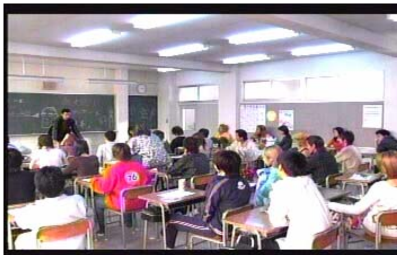
Gambar 17 subbab 3.5