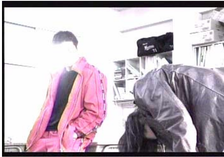
Gambar 18 subbab 3.5