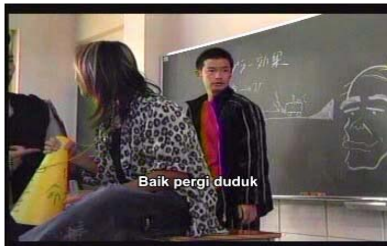
Gambar 8 subbab3.2