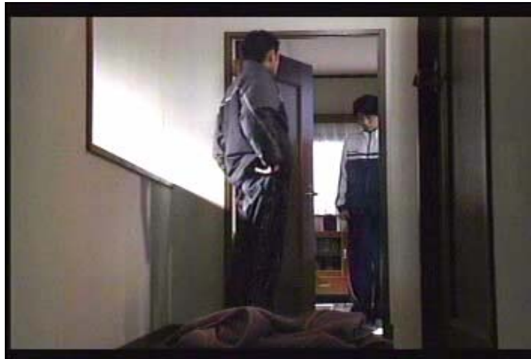
Gambar 3 subbab 3:1