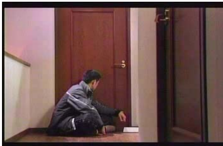
Gambar1 subbab 3.1