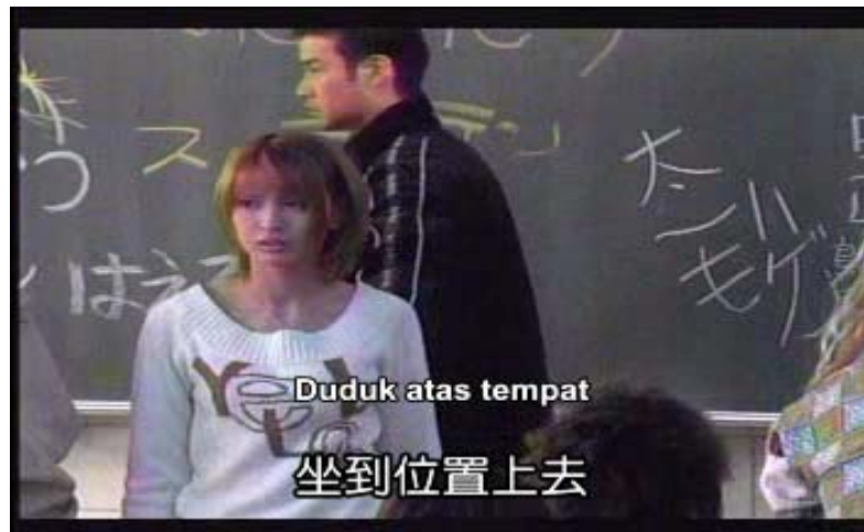
Gambar 7 subbab 3.3