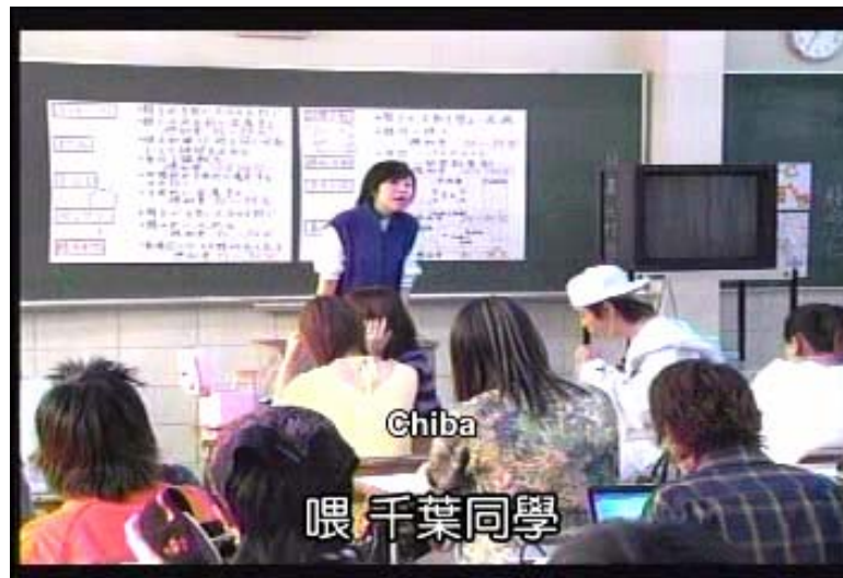
Gambar 9 subbab 3.2