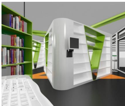
Gambar 5.1 Perspektif Rak Buku Perpustakaan

Dengan landasan teori bentuk yang sederhana, tidak memiliki banyak sudut, bertekstur mengkilap, pemakaian sedikit warna, fungsional dan memakai tehknologi yang lebih canggih lagi. Semua itu tercermin pada desain sekolah akselerasi ini. Seperti pada gambar berikut: