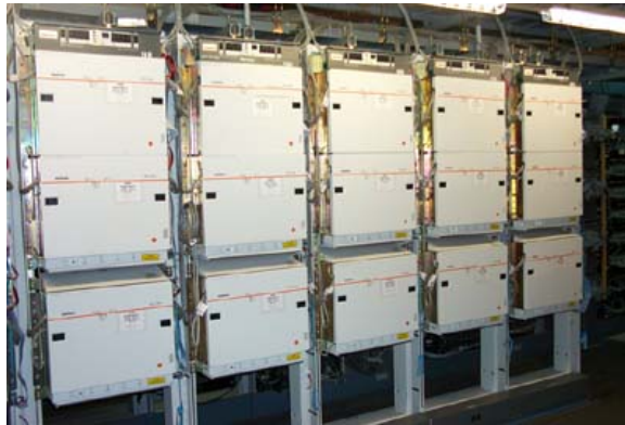
Gambar Sentral Telepon (Bagian dalam)