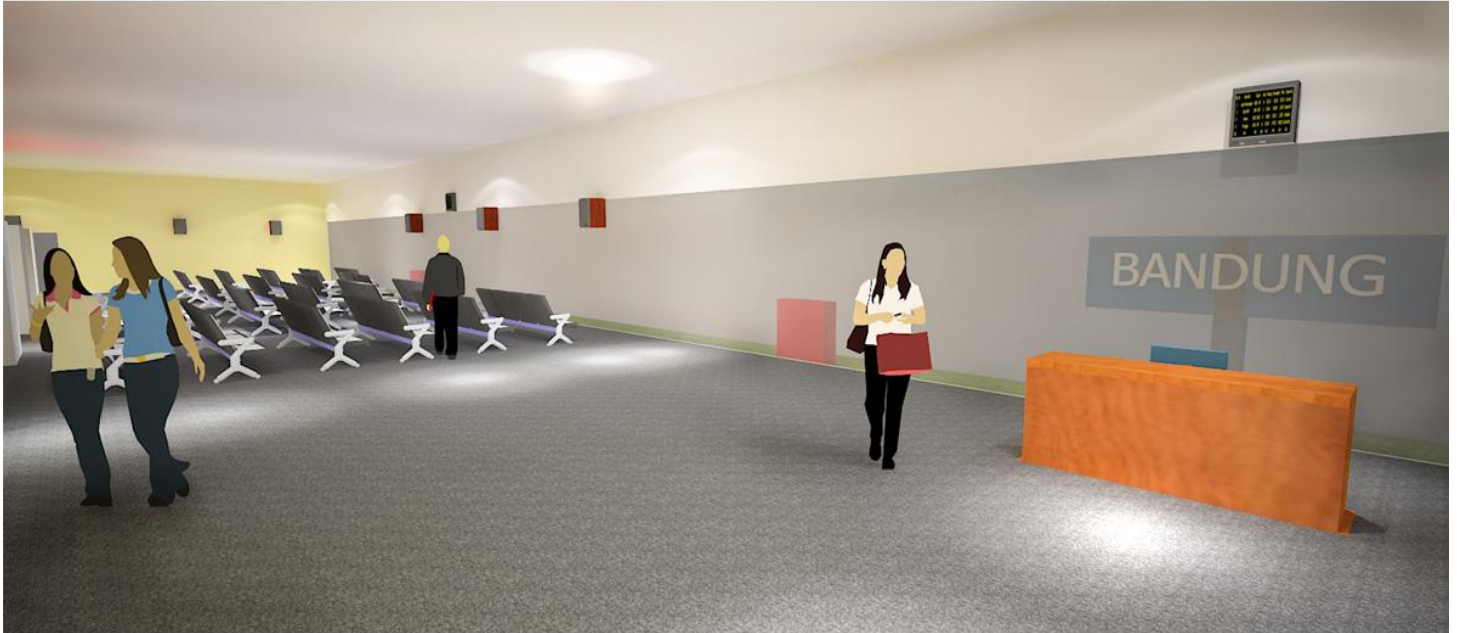
AREA TUNGGU UMUM (PINTU MASUK UTARA)