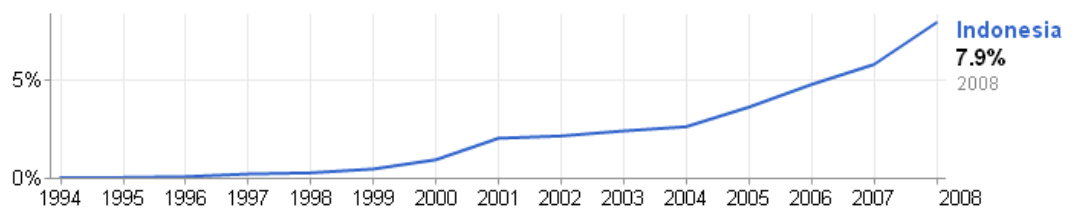
Gambar 1.2 Kecenderungan Persentase Pengguna Internet Indonesia

kurang mengerti perkembangan internet, namun bagi pengusaha yang mengerti dan mengikuti perkembangan internet ini adalah peluang untuk mempermudah dalam usaha mendapatkan konsumen.