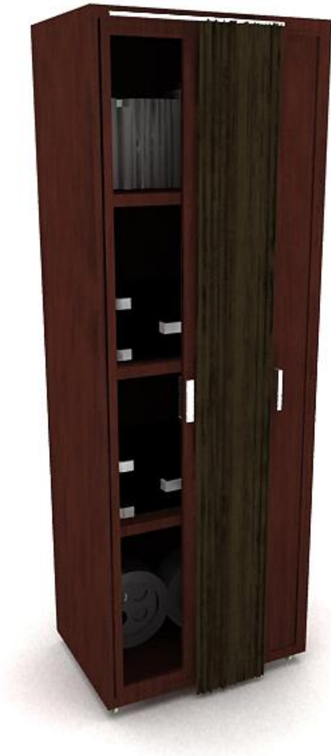
Lemari dengan Tirai Terbuka Separuh