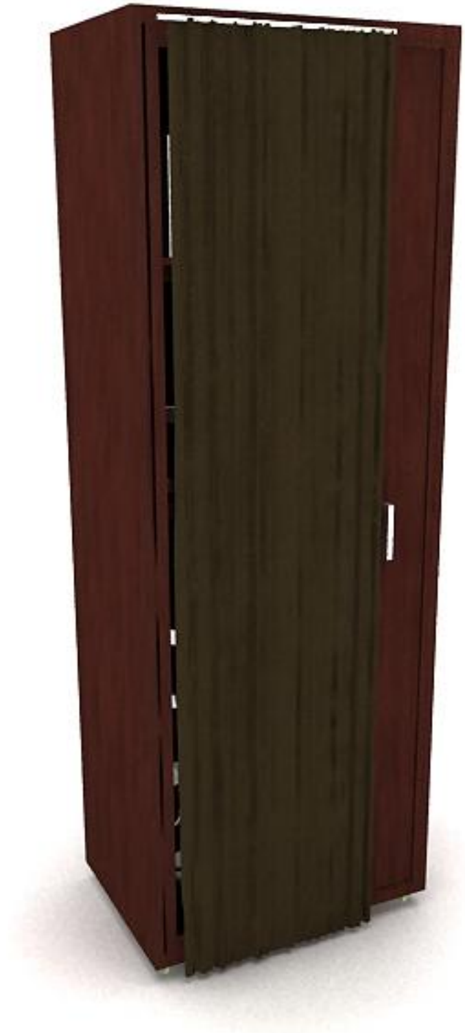
Lemari dengan Tirai Tertutup