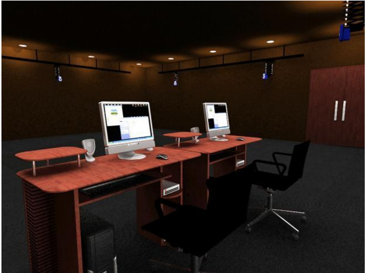
Layout Ruangan Motion Capture