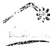
Denok Widawati Acct. Receivable