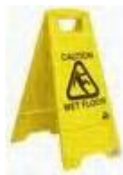
Gambar 7.3 Papan wet floor Usulan