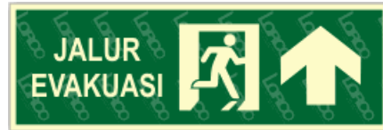
Gambar 7.4 Rambu jalur evakuasi Usulan