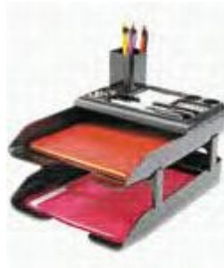
Gambar 7.1 Paper Tray Usulan