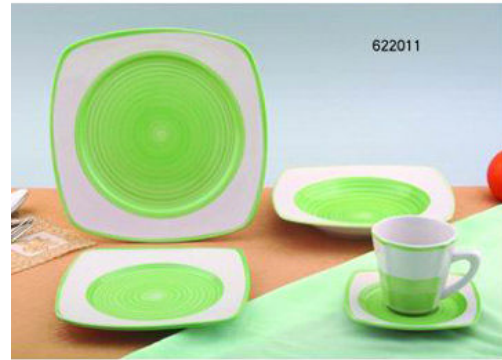
30 Pc hand painted stone dinnerware