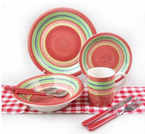
Handpainted Stoneware Dinner Set