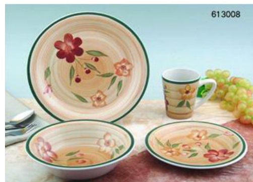
Stoneware 16pc Hand Painted Dinnerware