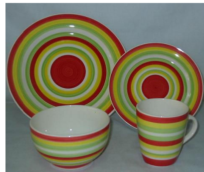
Earth ware 16pcs usd4 50 set