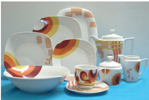
47pc Super White Square DinnerSet