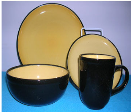
16 Pc 2 tone colour coupe shape dinner set