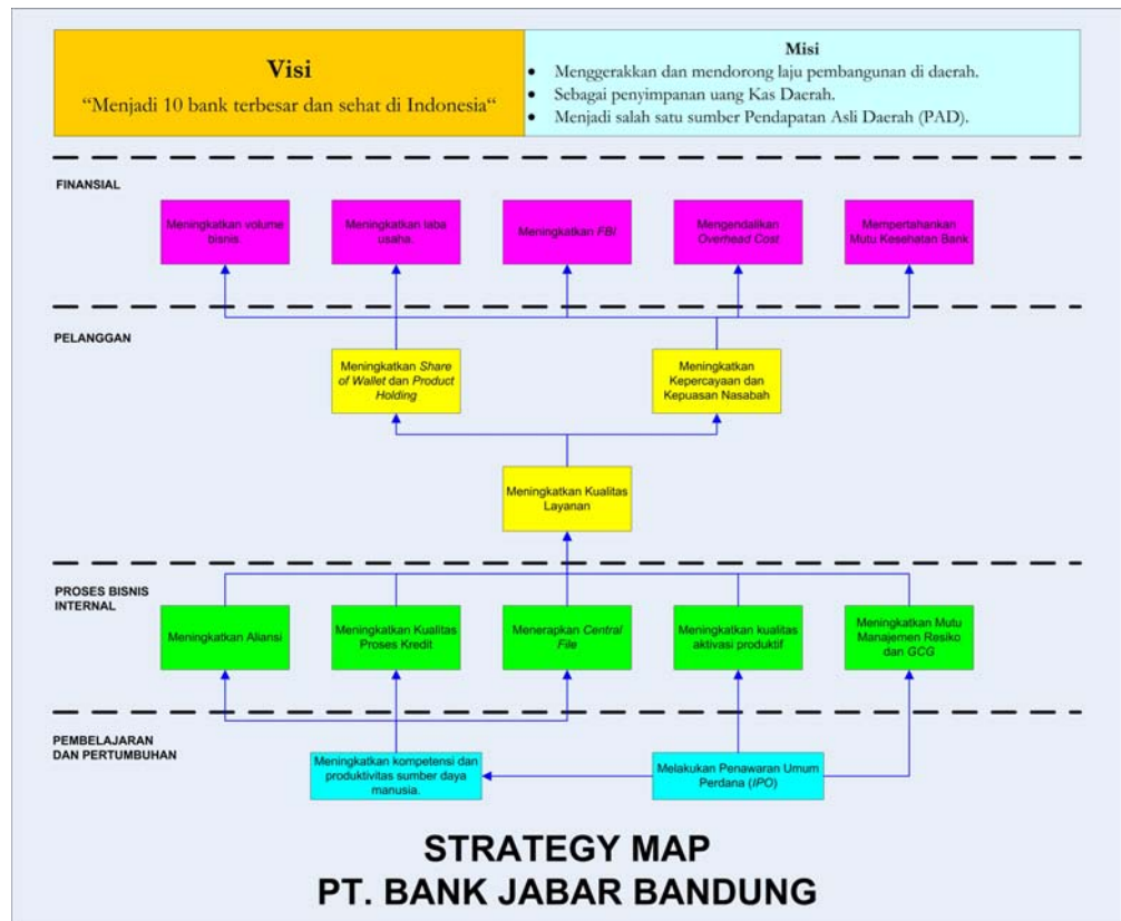
Gambar 6.1 Strategy Map PT. Bank Jabar.