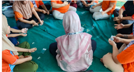
Gambar 4. Gambaran situasi ketika dilakukan pelatihan.

Dalam pelatihan secara luring yang dilakukan, sebagaimana pengajaran dengan teknik Feynman yang memberdayakan fasilitator untuk kemudian melakukan relay materi secara getok tular, maka para pelatih yang melakukan pelatihan adalah pihak-pihak petugas lapas yang telah mengenal para warga binaan, sehingga pengajaran tidak canggung, dapat berinteraksi dengan pendekatan yang lebih akrab dengan tetap didampingi oleh tim pengabdian dan pihak mitra industri yang menjadi mentor utama.