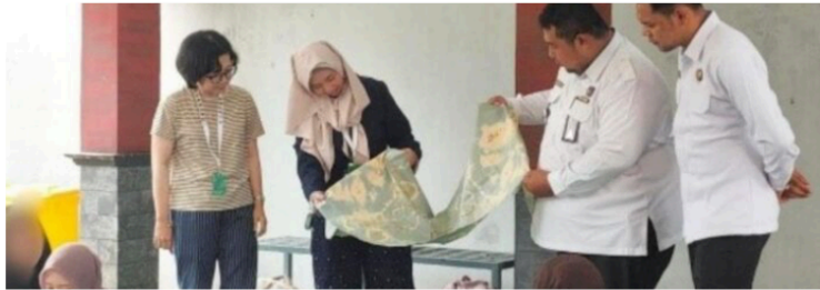
Gambar 3. Bahan katun yang telah diproses dengan metode tie dye .