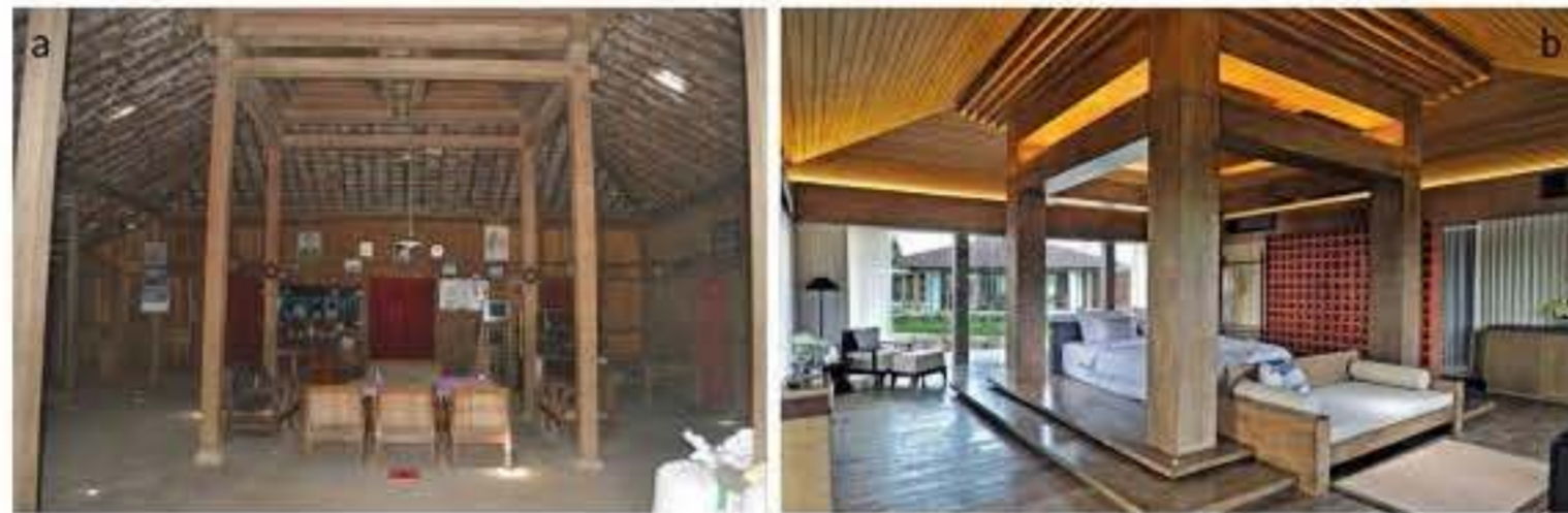
Gambar 7. Tampilan Konstruksi Soko Guru rumah Joglo dalam: (a) rumah cagar budaya Suwardi Trenggono Kidul Ponjong, Jogjakarta ( Jogjacagar.Jogjaprov.Go.Id , n.d.) dan (b) interpretasi modern tampilan soko guru ( Djoglo.Co , n.d.).

ahistoris. Rekonsiliasi ini justru membuka peluang bagi arsitektur tradisional untuk tetap eksis sebagai sumber pengetahuan dan nilai dalam menghadapi perubahan zaman. Melalui pendekatan reflektif dan kritis, arsitektur Indonesia dapat menghadirkan ekspresi ruang yang mungkin terasa berbeda secara visual dan teknis, tetapi tetap mengandung nilai luhur yang sama sebagai penanda jati diri budaya.