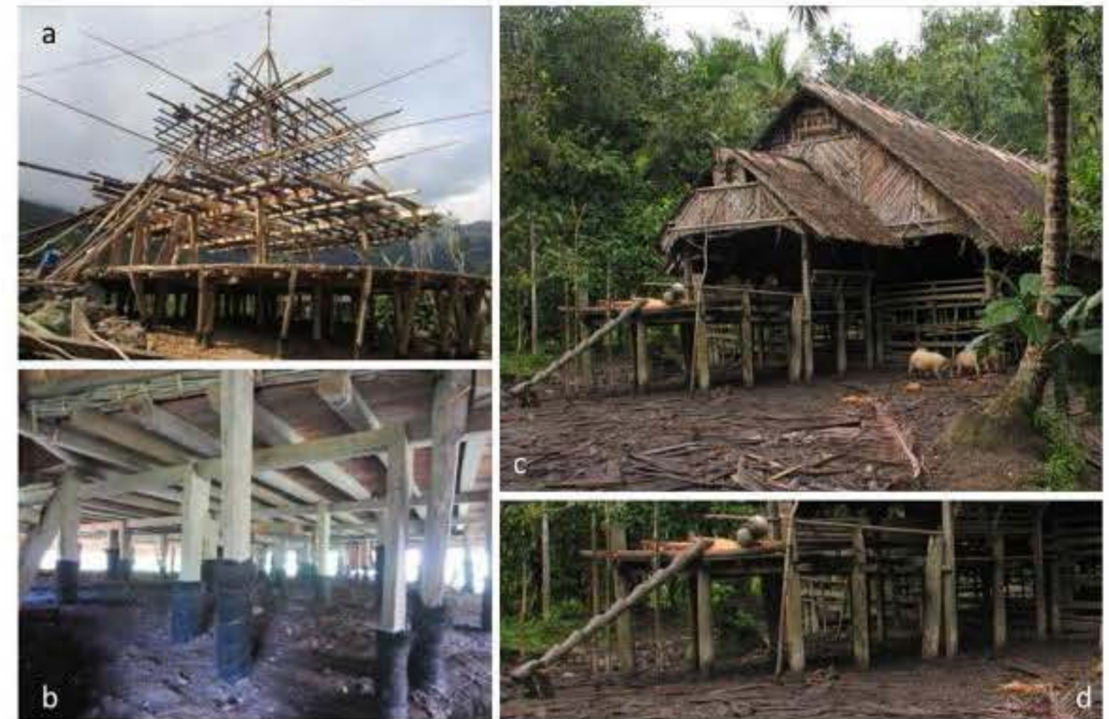
Gambar 3. (a) Rekonstruksi proses pendirian rumah adat tradisional Mbaru Niang–Waerebo (bandanaku, 2014), (b) detail konstruksi fondasi Mbaru Niang (bandanaku, 2014), (c) Rumah tradisional suku Mentawai (wikipedia, nd), (d) detail konstruksi fondasi Uma, Mentawai (wikipedia, nd)—Contoh membangun dengan teknologi yang dikenal menurut tingkat pengetahuan lokal pada masanya.