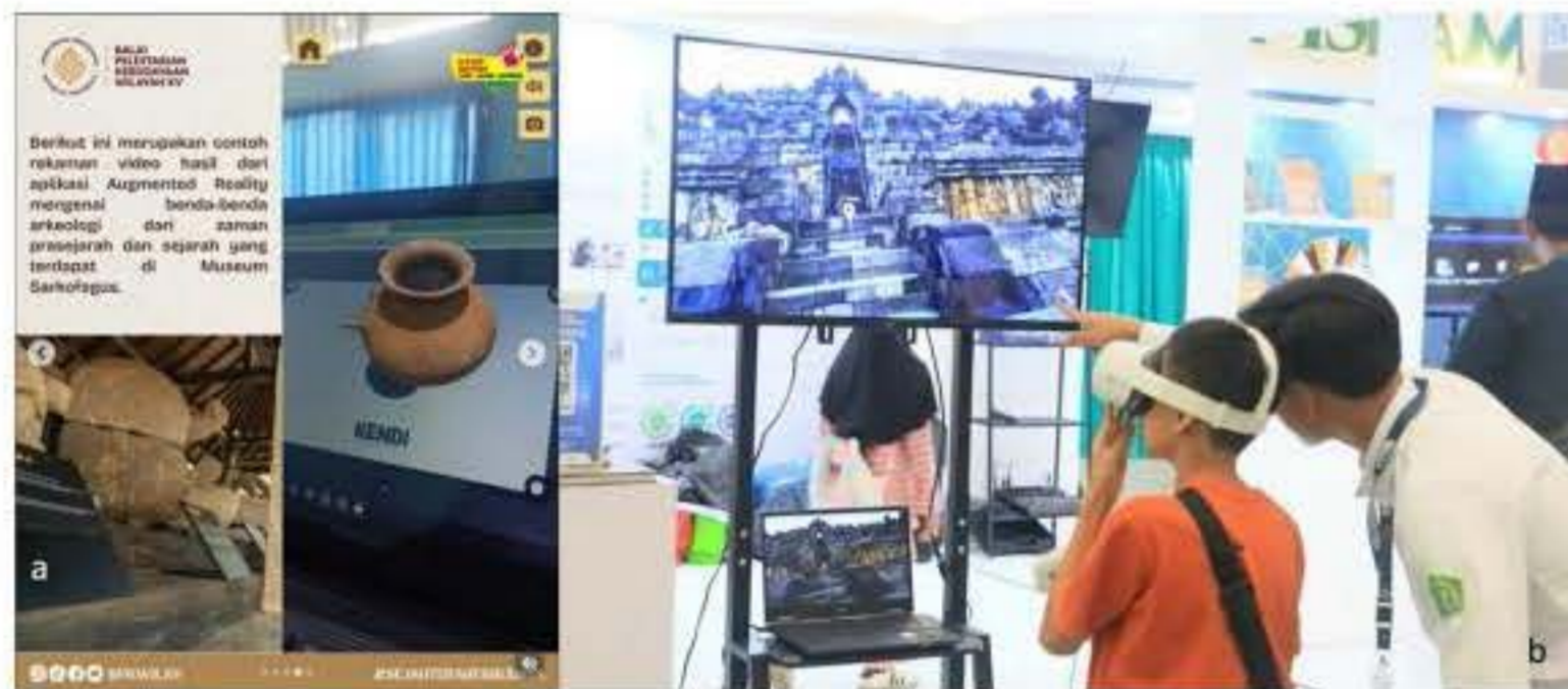
Gambar 6. Contoh penerapan teknologi digital realitas berimbuah (a) untuk memvisualisasikan artefak secara interaktif di museum sarkofagus (bpkwilxv, 2025), dan realitas maya (b) untuk tur maya candi Borobudur (Budiyono, 2024).

melalui media VR untuk pelestarian arsitektur bersejarah. Dengan dukungan pindai laser 3D dan architectural information modeling , VR memungkinkan pengunjung mengalami kembali arsitektur yang 'telah hilang atau berubah', seolah bertualang nyata berinteraksi dengan skala dan proporsi ruang dalam skala sebenarnya. Dalam konteks pelestarian, pendekatan ini menghadirkan dimensi baru yang mampu menghidupkan memori spasial dan makna emosional melalui simulasi digital.