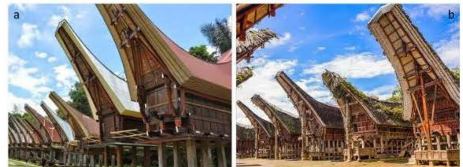
Gambar 4. Rumah adat tradisional Toraja, Tongkonan yang sudah material atapnya sudah menggunakan material modern berupa lembaran metal ringan (a), dan yang masih menggunakan material alami dari tumpukan belahan bambu (b) (Brighton, 2024)—Sebuah kontradiksi dalam pelestariankah pemanfaatan material modern?