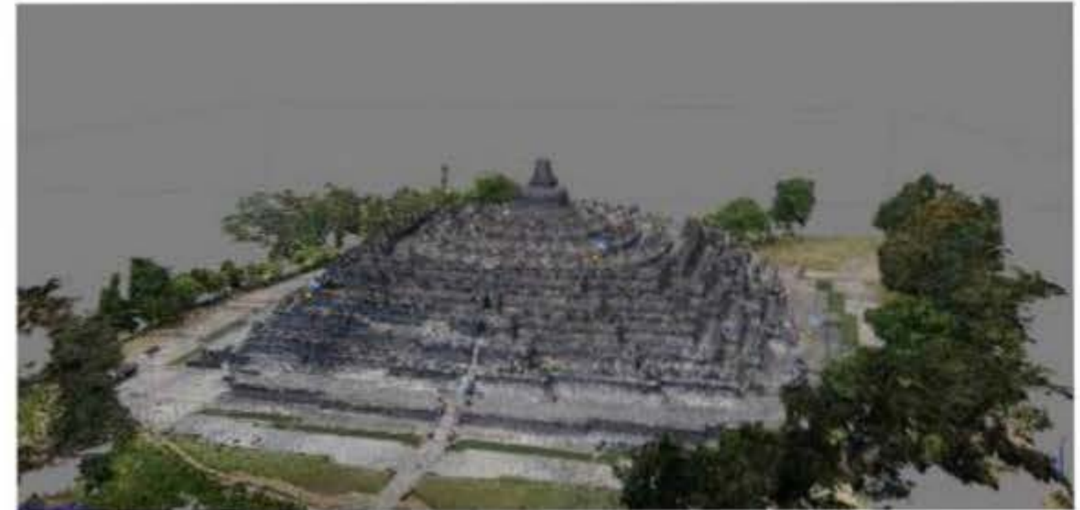
Gambar 1. Fotogrametri digunakan dalam sebagian proses preservasi heritage -BIM candi Borobudur yang menghasilkan data digital yang akurat, cepat, dan masif. (Mukhlisin, 2016)