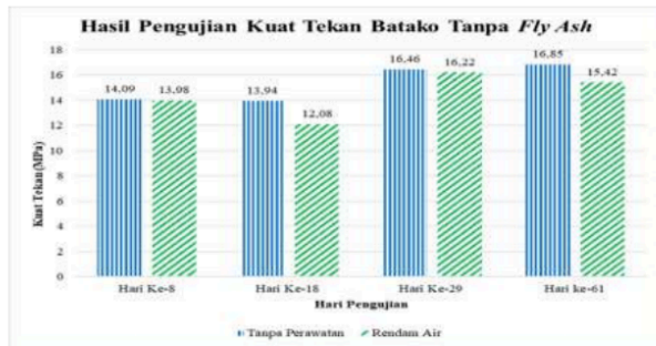
7 Gambar 10. Perbandingan hasil pengujian kuat tekan batako tanpa fly ash di pabrik

perawatan rendam air. Perbandingan rata-rata kuat tekan dengan metode perawatan rendam air dan metode tanpa perawatan pada paving block yang memiliki kandungan fly ash 20% dapat dilihat pada Gambar 13. Pada gambar tersebut dapat dilihat bahwa perbedaan hasil rata-rata kuat tekan kedua metode tersebut tidak berbeda jauh. Pada semua umur perawatan, metode tanpa perawatan lebih unggul daripada metode rendam air, kecuali pada umur perawatan 29 hari.