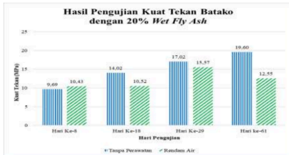
Gambar 11. Perbandingan hasil pengujian kuat tekan batako dengan 20% wet fly ash di pabrik