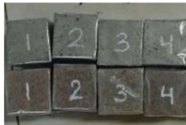
Gambar 4. Metode perawatan bungkus plastik di laboratorium

Perawatan bungkus plastik dilakukan dengan membungkus permukaan benda uji menggunakan lembaran plastik (SNI 4810:2013) seperti pada Gambar 4. Lembaran plastik berfungsi untuk mencegah adanya celah udara masuk serta menjaga agar kandungan air dalam