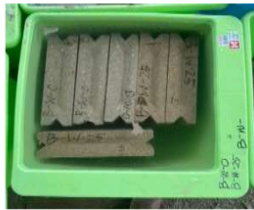
Gambar 6. Metode perawatan rendam air di pabrik

lebih banyak dibandingkan dengan di laboratorium. Prosedur metode perawatan rendam air dan metode tanpa perawatan yang dilaksanakan di pabrik sama seperti prosedur yang telah dilakukan di laboratorium. Pelaksanaan metode perawatan rendam air dan metode tanpa perawatan di pabrik secara berturut-turut dapat dilihat pada Gambar 6 dan Gambar 7.