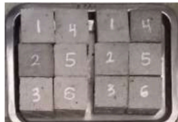
Gambar 5. Metode tanpa perawatan di laboratorium

Gambar 5 merupakan dokumentasi metode tanpa perawatan. Metode tanpa perawatan dilakukan dengan membiarkan benda uji terpapar udara secara langsung tanpa tindakan perawatan khusus.