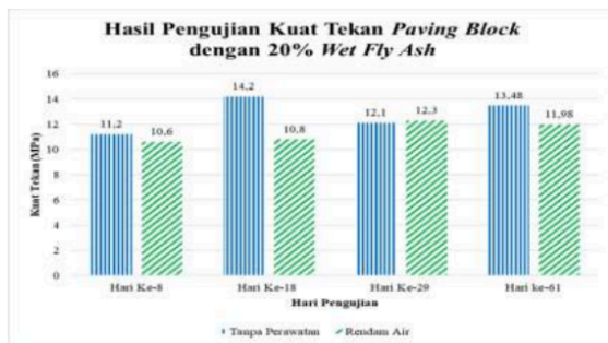
Gambar 13. Perbandingan hasil pengujian kuat tekan paving block dengan 20% wet fly ash di pabrik

paling sesuai untuk batako dan paving block tanpa fly ash maupun batako dan paving block dengan fly ash adalah metode tanpa perawatan. Hal tersebut sama seperti penelitian yang telah dilakukan oleh Koelima dkk (2023), bahwa metode tanpa perawatan, terutama yang dilakukan di luar ruangan, merupakan metode perawatan yang paling sesuai untuk benda uji dengan fly ash.