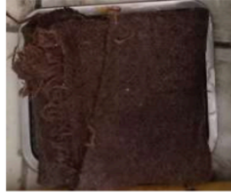
Gambar 3. Metode perawatan bungkus goni basah di laboratorium

Gambar 3. Kain goni yang digunakan harus dibasahi secara berkala agar tidak kering.