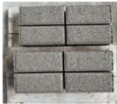
Gambar 7. Metode tanpa perawatan di pabrik