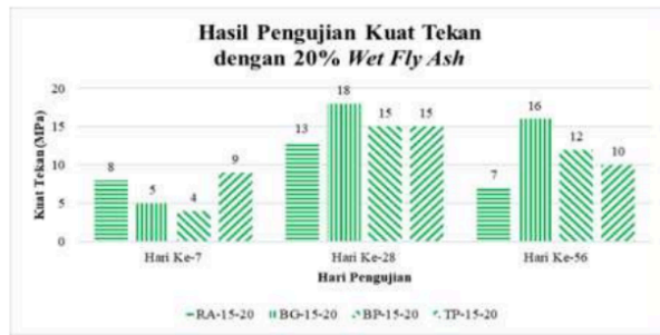
Gambar 9. Perbandingan hasil pengujian kuat tekan benda uji dengan 20% wet fly ash di laboratorium

Berdasarkan Gambar 8 dan Gambar 9, rata-rata umur perawatan yang menghasilkan kuat tekan tertinggi di laboratorium adalah 28 hari, sama seperti penelitian yang dilakukan oleh Bingöl & Tohumcu (2013). Pada hari ke-7, metode perawatan untuk benda uji tanpa fly ash dan 20 % fly ash dengan kuat tekan tertinggi adalah metode tanpa perawatan. Metode perawatan bungkus goni basah mengalami kenaikan kuat tekan pada hari ke-28 sehingga menjadi metode perawatan dengan kuat tekan tertinggi. Hal tersebut dapat terjadi karena kadar air yang dibutuhkan dan kadar air pada goni dalam kondisi seimbang sehingga dapat mempercepat hidrasi semen dan meningkatkan kuat tekan. Namun, pada hari ke-56 terjadi penurunan kuat tekan pada seluruh metode perawatan.