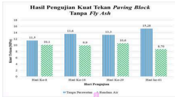
Gambar 12. Perbandingan hasil pengujian kuat tekan paving block tanpa fly ash di pabrik

Berdasarkan Gambar 12 dan Gambar 13, paving block dengan metode perawatan rendam air mengalami kenaikan kuat tekan sampai umur perawatan 29 hari dan kemudian menurun pada hari ke-61. Kuat tekan paving block dengan metode tanpa perawatan mengalami kenaikan sampai umur perawatan 18 hari lalu menurun pada hari ke-29 dan naik kembali pada hari ke-61.