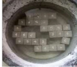
Gambar 2. Metode perawatan rendam air di laboratorium

menutup permukaan benda uji dengan menggunakan kain goni basah. Perawatan benda uji dengan metode bungkus goni basah dapat dilihat pada