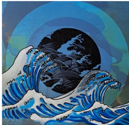
Gambar 4. Karya Kesatu “ Postwave ”, 21cm x 21cm, Pensil, Cat Akrilik, Marker , pada Material Bercetak-Visual dari Sebuah Kalender Bekas, 2023

Dua , memanfaatkan konsep random, pada pola ini penulis masih menggunakan material karton bercetak-visual dari seri kalender bekas produksi dan tahun yang sama dengan lukisan kesatu. Namun Penulis menggambarkannya dengan objek visual random, yaitu tidak ada hubungan kemiripan visual dengan latar gambar yang tercetak pada kalender tersebut. Pada