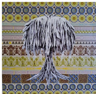
Gambar 6. Karya Kedua “Hayatree”, 2003, 21cm x 21cm, Medium Pensil, Bolpen, dan Cat Akrilik pada Material Bercetak-Visual dari Sebuah Kalender Bekas