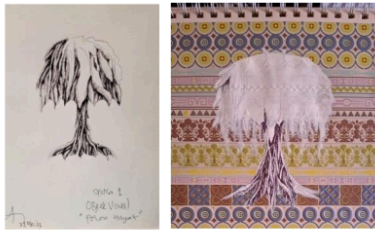
Gambar 5. Sketsa Menggunakan Media Bolpen pada Kertas ( kiri ), dan Aplikasi Sketsa pada Material Bercetak-Visual ( Kanan )

karya kedua berjudul “Hayatree” ini penulis justru menyiapkan gambar sketsa yang lebih dahulu dibuat sebelum dilakukannya pemilihan material bidang lukis.