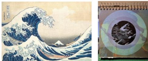
Gambar 2. Kiri : Foto Lukisan Hasil Karya Hokusai (1831), Berjudul “ Kanagawa-oki Nami Ura ”.

Penciptaan lukisan diawali dengan cara mencari dan memilih material bergambar untuk dijadikan latar lukisan, lalu meresponnya dengan dua macam pola, yaitu: apropriasi dan random. Satu , memanfaatkan konsep apropriasi, yaitu meminjam gambaran dari karya serupa terkemuka untuk kemudian digambar ulang pada bidang natar yang sekilas tampak ada kemiripan visual. Pada pola ini, Penulis memilih salah-satu karya lukisan berjudul “ Kanagawa-oki Nami Ura ” gubahan seniman klasik Jepang bernama Katsushika Hokusai (1831) yang tampak pada Gambar-2 (kiri), dan kemudian diimprovisasi pada bidang bergambar dari sebuah kalender bekas bertahun 2013 pada Gambar-2 (kanan). Konsep penggambarannya adalah merespon gambar latar atas dasar kemiripan—terlepas dari asumsi apakah desainer kalender tersebut juga terinspirasi oleh ‘Kanagawa’nya Hokusai.