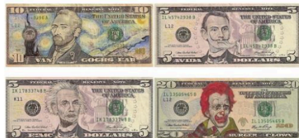
Gambar 1. Karya Seni Gambar Menggunakan Material Bercetak-Visual Karya James Charles (2012).

Penulis memanfaatkan fenomena pergeseran ini untuk menciptakan karya yang dilakukan melalui tiga tahapan sebagai berikut: pada tahap eksplorasi Penulis melakukan pendalaman referensi melalui studi pustaka dan studi komparasi visual. Tahapan improvisasi dilakukan dengan cara eksperimentasi alat gambar untuk menemukan efektifitas aplikasi, dan eksplorasi visual melalui pembuatan alternatif sketsa gambar. Sebagai bentuk eklektikitas maka tahap implementasi dilakukan dengan perwujudan karya lukisan melalui pemanfaatan bidang bergambar sebagai latarnya. Dan dihasilkanlah dua karya lukis berjudul “ Postwave ” dan “ Hayatree ”, masing-masing dalam ukuran yang sama berdimensi 21cm2 (dua puluh satu centimeter persegi).