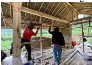
Gambar 10. Tahapan Pemasangan Jendela dan Pintu