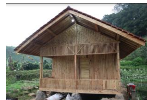
Tampak Depan Bangunan