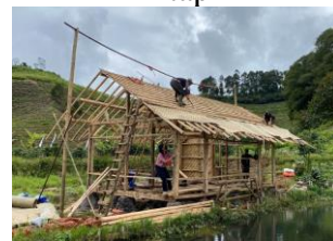
Gambar 8. Tahapan Pemasangan Genteng