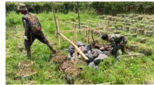
Gambar 3. Tahapan Persiapan Pembuatan Pondasi