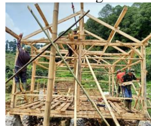
Gambar 6. Tahapan Perakitan Komponen Struktur Utama Kolom dan Balok