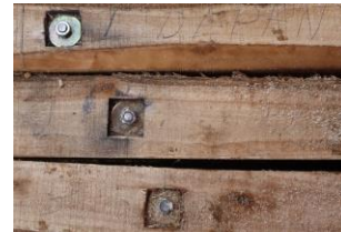
Gambar 4. Tahapan Persiapan Perakitan Kolom dan Balok Kayu Laminasi