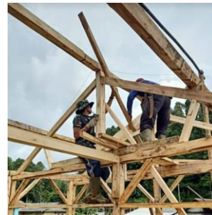
Gambar 7. Tahapan Pemasangan Konstruksi Atap