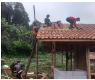
Gambar 9. Tahapan Pemasangan Dinding