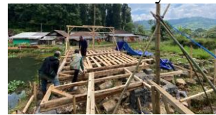
Gambar 5. Tahapan Pemasangan Papan Lantai Bangunan