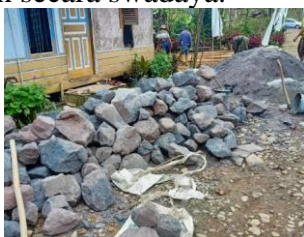
Gambar 2. Tahapan Awal Persiapan Pengadaan Material

Tujuan kegiatan kedua adalah menyediakan bangunan penginapan untuk peningkatan jumlah okupansi wisatawan. Status kepemilikan lahan adalah bangunan berdiri diatas tanah milik warga, dengan pengelolaan secara swadaya.