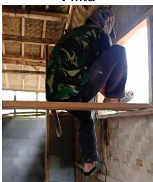
Gambar 11. Tahapan Lanjutan Pemasangan Dinding