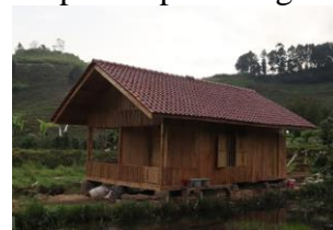
Tampak Samping Bangunan