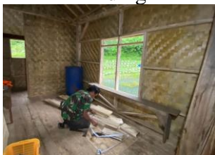
Gambar 12 Tahapan Pemasangan Instalasi Listrik