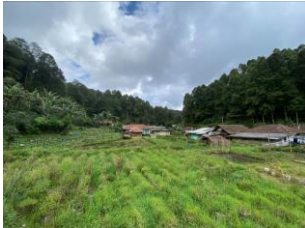
Gambar 1. Kampung Stamplat, Desa Indragiri, Kecamatan Rancabali, Kabupaten Bandung

Kegiatan pengabdian kepada masyarakat dalam tulisan ini bertujuan untuk langkah penguatan potensi Kampung Stamplat Desa Indragiri pada bidang/sektor wisata, melalui implementasi kepakaran/hasil penelitian dosen dan implementasi MBKM lintas disiplin ilmu.