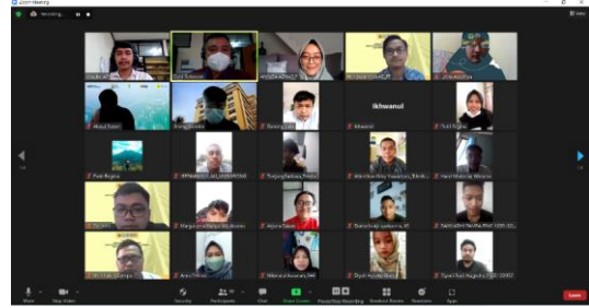
Gambar 22. Kegiatan Kuliah Umum

pengembangan bangunan ini. Poster kegiatan ini dapat dilihat pada Gambar 23.