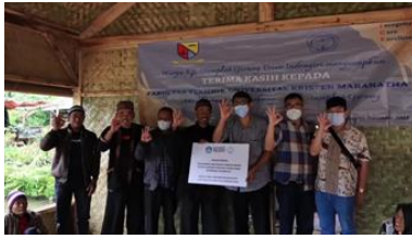
Gambar 20. Acara Serah Terima

Pada tanggal 29 Desember 2021 dilaksanakan kegiatan diskusi dalam bentuk kuliah umum bersama dengan Program Studi Teknik Sipil Universitas Veteran Bangun Nusantara Sukoharjo. Adapun tujuan dari kegiatan ini adalah membagikan ilmu pengetahuan dalam hal bangunan modular tahan gempa yang terbuat dari material kayu bagi para civitas akademika, selain itu dalam diskusi ini juga mendapatkan saran untuk pengembangan bangunan ini. Poster kegiatan Kuliah Umum tersaji pada Gambar 21 dan kegiatannya tersaji pada Gambar 22.