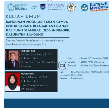
Gambar 23. Kuliah tamu bersama Universitas Tanri Abeng dan Universitas 17 Agustus 1945

Fungsi pengabdian masyarakat adalah transfer dan hilirisasi hasil penelitian dalam bentuk bangunan kayu tahan gempa. Edukasi bagi warga kampung stamplat, khususnya pemuda dan orang tua (pria) mengenai teknologi bangunan kayu tahan gempa, baik dari sisi mutu material maupun konstruksi bangunannya.