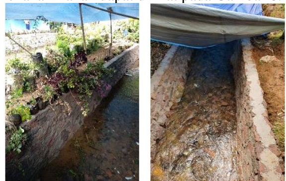
Gambar 8. Pekerjaan Dinding Penahan Tanah

Pada Sabtu, 18 Desember 2021 dilaksanakan kegiatan pekerjaan dinding penahan tanah untuk area bangunan. Pekerjaan dinding penahan tanah ini perlu dilakukan karena lokasi bangunan ini melintang sungai yang melintasi kampung Stamplat, sehingga perlu membuat perkuatan area bangunan. Hasil pekerjaan Dinding Penahan Tanah dapat dilihat pada Gambar 8.