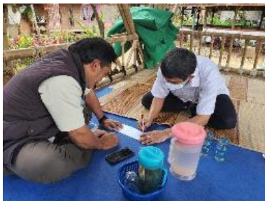
Gambar 6. Diskusi Teknis Tahapan Pembangunan Bangunan

Pada Kamis, 16 Desember 2021 dilaksanakan diskusi Teknis Tahapan Pembangunan Bangunan serta dilanjutkan dengan pembagian tugas pengawasan, pembangunan, dan logistik. Diskusi ini membahas konsep desain bangunan kayu hilirisasi hasil penelitian sebelumnya kepada masyarakat kampung Stamplat dan dapat dilihat pada Gambar 6.