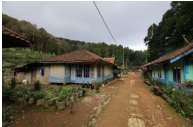
Gambar 1. Jalan Utama Kampung Stamplat

584 rumah tanggung sedangkan hanya terdapat 15 rumah permanen saja. Untuk fasilitas kesehatan terdapat 10 buah Posyandu dan 1 buah Puskesmas. Desa Indragiri dipimpin oleh 1 orang kepala desa dan 7 orang perangkat Desa, terdapat 4 orang kepala Dusun yang membawahi 10 unit RW dan 34 Unit RT. Desa Indragiri memiliki 4 dusun yang menyebar. Salah satunya adalah Dusun Ciparay yang didalamnya terdapat Kampung Stamplat. Di Kampung ini hidup 28 Kepala Keluarga yang pada umumnya bermata pencaharian sebagai petani sayuran, petani kopi, peternak, dan pegawai perkebunan teh. Kampung Stamplat sendiri merupakan salah satu kampung yang posisinya paling dalam dan merupakan kampung terkecil di Desa Indragiri. Potensi yang dimiliki oleh dusun ini sangat potensial tetapi memang dusun ini kurang memiliki fasilitas yang memadai (Gambar 1 dan Gambar 2).