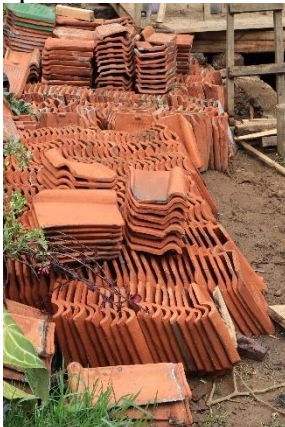
Gambar 5. Kegiatan Survei Material

Pada Rabu, 15 Desember 2021 dilaksanakan kegiatan survei toko material bangunan. Kegiatan ini melibatkan tokoh masyarakat kampung Stamplat serta pemuda Karang Taruna Desa Indragiri. Kegiatan ini dapat dilihat pada Gambar 5.