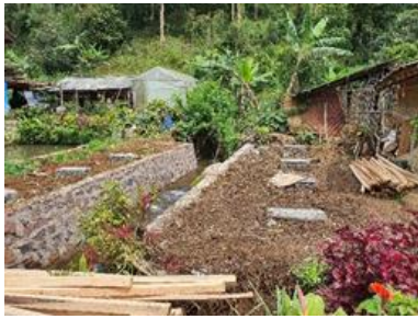
Gambar 9. Pekerjaan Dudukan Pondasi

Pada Senin, 20 Desember 2021 dilaksanakan perakitan balok lantai 5 bentang meter, perakitan balok lantai bentang 7 meter, dan memasang Balok bentang 5 meter dan balok bentang 7 meter. Pelaksanaan kegiatan ini memberdayakan masyarakat kampung stamplat dan didampingi tim pengabdian kepada masyarakat. Hasil pekerjaan perakitan balok dapat dilihat pada Gambar 10.