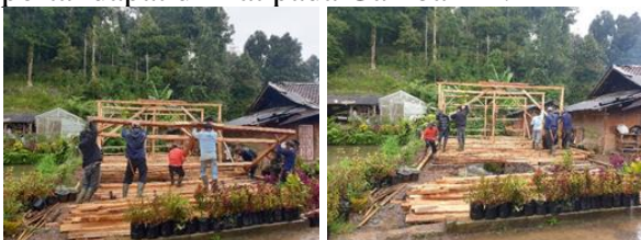
Gambar 11. Pekerjaan Perakitan Kolom dan Portal

Selasa, 21 Desember 2021 dilaksanakan kegiatan merakit kolom, merakit balok ring, merakit portal, pasang portal, memasang balok ring, memasang balok dudukan atap dan membersihkan dan menyiapkan Genteng. Seluruh kegiatan ini melibatkan baik para pria dewasa dan juga para ibu masyarakat Kampung Stamplat. Para pria membantu merakit seluruh komponen sedangkan para ibu membantu membersihkan genteng. Adapun hasil pekerjaan perakitan kolom dan portal dapat dilihat pada Gambar 11.