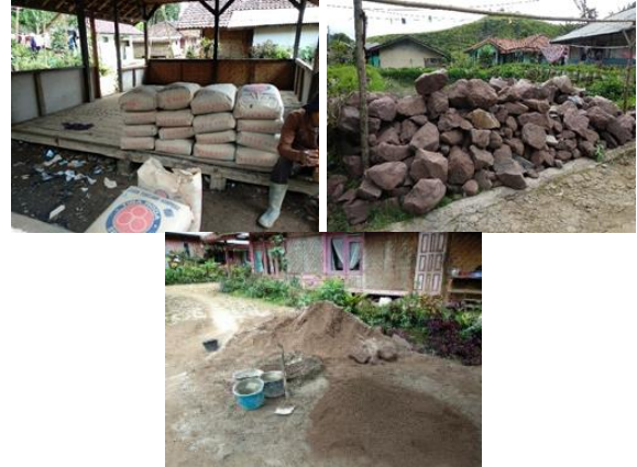
Gambar 7. Pengadaan Material

Pada Jumat, 17 Desember 2021 dilaksanakan kegiatan pengadaan material batu, pasir, kerikil, semen, dan terpal. Proses pengadaan ini juga melibatkan masyarakat Kampung Stamplat dengan memanfaatkan jejaring toko material setempat, dokumentasi dapat dilihat pada Gambar 7.