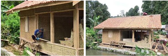
Gambar 15. Kegiatan Pemasangan Kusen Pintu dan Jendela serta Pemasangan Dinding Tahap 3

tahap 3. Kegiatan ini juga melibatkan masyarakat Kampung Stamplat. Hasil kegiatan pemasangan kusen pintu dan jendela serta pemasangan dinding tahap 3 dapat dilihat pada Gambar 15.