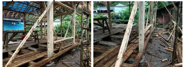
Gambar 13. Pekerjaan Pemasangan Reng, Pemasangan Lantai dan Pemasangan Dinding

Pada Kamis, 23 Desember 2021 dilaksanakan pekerjaan pemasangan reng, pemasangan lantai dan pemasangan dinding. Pelaksanaan pekerjaan ini dilaksanakan oleh masyarakat Kampung Stamplat. Hasil kegiatan pekerjaan pemasangan reng, pemasangan lantai dan pemasangan dinding dapat dilihat pada Gambar 13.