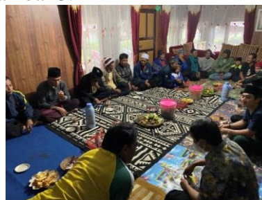
Gambar 3. Koordinasi Kegiatan Pengabdian Kepada Masyarakat Dengan Tokoh Masyarakat Kampung Stamplat

Pada Senin, 13 Desember 2021 dilaksanakan koordinasi PIC kegiatan dan pembagian tugas tim kerja, kemudian dilanjutkan dengan koordinasi rencana Pembangunan Rumah 5 x 7 m 2 di Kampung Stamplat bersama dengan Kepala Desa dan tokoh masyarakat setempat dan ditunjukkan pada Gambar 3.