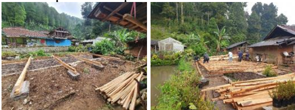
Gambar 10. Pekerjaan Perakitan Balok

Pada Senin, 20 Desember 2021 dilaksanakan perakitan balok lantai 5 bentang meter, perakitan balok lantai bentang 7 meter, dan memasang Balok bentang 5 meter dan balok bentang 7 meter. Pelaksanaan kegiatan ini memberdayakan masyarakat kampung stamplat dan didampingi tim pengabdian kepada masyarakat. Hasil pekerjaan perakitan balok dapat dilihat pada Gambar 10.