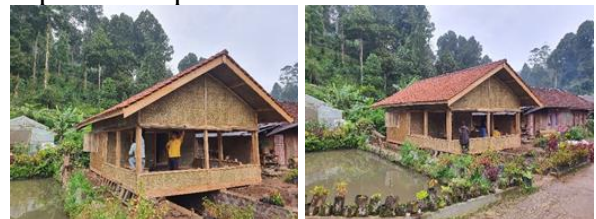
Gambar 19. Kegiatan Finishing

Pada Selasa, 28 Desember 2021 dilaksanakan pekerjaan finishing . Kegiatan ini merupakan kegiatan yang melibatkan masyarakat kampung Stamplat dan juga pemuda Karang Taruna secara bergotong royong. Hasil kegiatan pekerjaan finishing dapat dilihat pada Gambar 19.