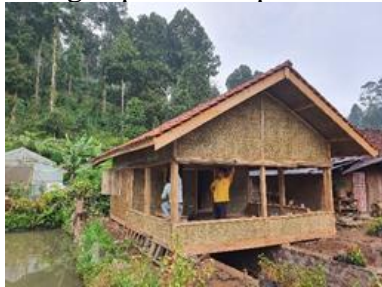
Gambar 16. Kegiatan Pernis Tiang dan Balok dan Pernis Dinding

Pada Minggu, 26 Desember 2021 dilaksanakan kegiatan pernis tiang dan balok dan pernis dinding. Kegiatan ini juga melibatkan masyarakat Kampung Stamplat. Hasil dari kegiatan pernis tiang dan balok dan pernis dinding dapat dilihat pada Gambar 16.