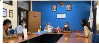
Gambar 17. FGD dengan Kepala Desa Indragiri di Universitas Kristen Maranatha

pria untuk melakukan proses pengecatan genteng. Proses pengecatan genteng ini dilakukan secara bertahap. Hasil kegiatan pengecatan genteng dan finishing dapat dilihat pada Gambar 18.