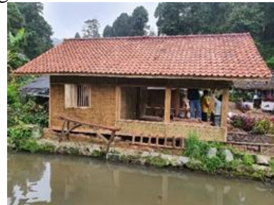
Gambar 18. Kegiatan Pengecatan Genteng dan Finishing

Pada Selasa, 28 Desember 2021 dilaksanakan pekerjaan finishing . Kegiatan ini merupakan kegiatan yang melibatkan masyarakat kampung Stamplat dan juga pemuda Karang Taruna secara bergotong royong. Hasil kegiatan pekerjaan finishing dapat dilihat pada Gambar 19.