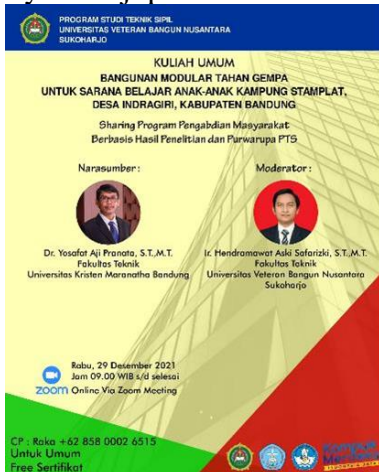
Gambar 21. Poster Kegiatan Kuliah Umum Dengan Universitas Veteran Bangun Nusantara

Pada tanggal 29 Desember 2021 dilaksanakan kegiatan diskusi dalam bentuk kuliah umum bersama dengan Program Studi Teknik Sipil Universitas Veteran Bangun Nusantara Sukoharjo. Adapun tujuan dari kegiatan ini adalah membagikan ilmu pengetahuan dalam hal bangunan modular tahan gempa yang terbuat dari material kayu bagi para civitas akademika, selain itu dalam diskusi ini juga mendapatkan saran untuk pengembangan bangunan ini. Poster kegiatan Kuliah Umum tersaji pada Gambar 21 dan kegiatannya tersaji pada Gambar 22.