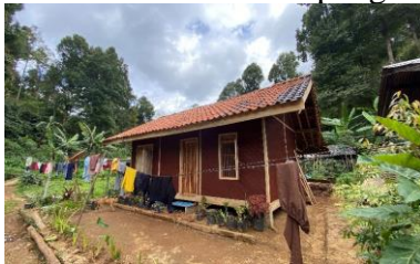
Gambar 2. Bangunan Rumah Penduduk

Gambaran umum masyarakat khususnya anak-anak di Dusun Stamplat, Desa Indragiri adalah Dusun Stamplat sendiri tidak memiliki fasilitas sekolah, sekolah terdapat di Desa Indragiri yang posisinya cukup jauh dengan berjalan kaki, kapasitas listrik rumah warga mayoritas masih 450 watt, hanya 3 rumah yang mempunyai listrik dengan kapasitas 900 watt. Hal ini mengakibatkan kendala penggunaan komputer bagi warga, belum ada bangunan fasilitas umum yang secara khusus digunakan untuk ruang belajar anak-anak dan pelajar.