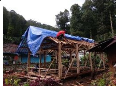
Gambar 12. Pekerjaan Konstruksi Atap

kegiatan pekerjaan konstruksi atap dapat dilihat pada Gambar 12.