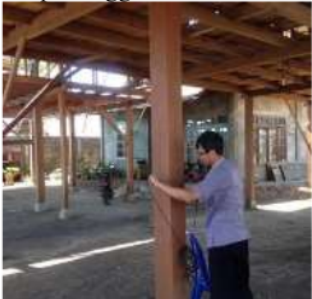
Gambar 1. Uji Deteksi Tiang/Kolom pada Bangunan Rumah Tinggal di Kota Manado Tahun 2015

Rumah-rumah yang mayoritas berfungsi sebagai rumah tinggal telah berdiri sejak beberapa tahun silam, yang mana tentunya berpotensi mengalami kerusakan baik non-struktural dan struktural (sebagian) akibat gempa bumi namun telah diperbaiki secara berkala sehingga tetap dapat berfungsi sebagai tempat tinggal dan aman.