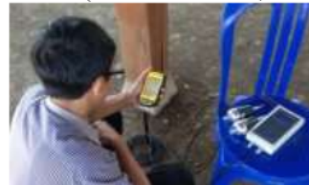
Gambar 3. Pembacaan Data pada Proses Pengujian (Pranata & Rusli, 2015).

Hasil kegiatan pengujian pada rumah tinggal di Kota Manado secara umum ditampilkan pada Gambar 4.