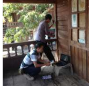
Gambar 2. Titik Pengambilan Sampel pada Tiang Bangunan Rumah Tinggal di Kota Manado (Pranata & Rusli, 2015).

perbaikan komponen bangunan yang mengalami kerusakan untuk diganti dengan kayu baru dengan kualitas yang setara.