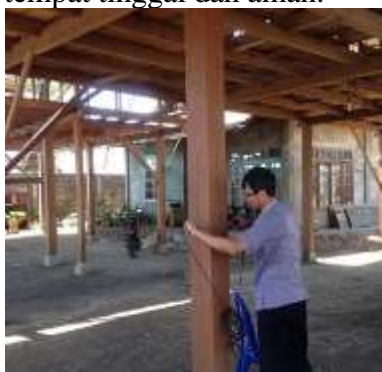
Gambar 1. Uji Deteksi Tiang/Kolom pada Bangunan Rumah Tinggal di Kota Manado Tahun 2015

Rumah-rumah yang mayoritas berfungsi sebagai rumah tinggal telah berdiri sejak beberapa tahun silam, yang mana tentunya berpotensi mengalami kerusakan baik non-struktural dan struktural (sebagian) akibat gempa bumi namun telah diperbaiki secara berkala sehingga tetap dapat berfungsi sebagai tempat tinggal dan aman.