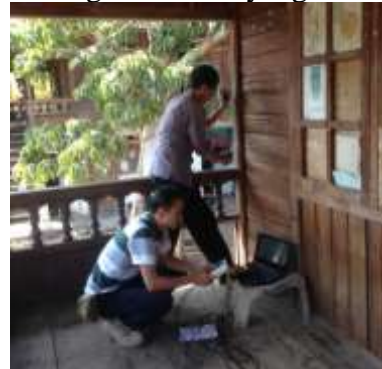
Gambar 2. Titik Pengambilan Sampel pada Tiang Bangunan Rumah Tinggal di Kota Manado (Pranata & Rusli, 2015).

perbaikan komponen bangunan yang mengalami kerusakan untuk diganti dengan kayu baru dengan kualitas yang setara.