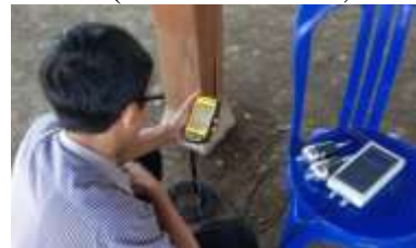
Gambar 3. Pembacaan Data pada Proses Pengujian (Pranata & Rusli, 2015).

Hasil kegiatan pengujian pada rumah tinggal di Kota Manado secara umum ditampilkan pada Gambar 4.