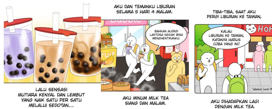
Gambar 8. Ilustrasi pengalaman Hong-kki pada webtoon "Mukbang Life"