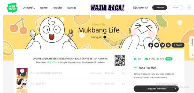
Gambar 1. Tampilan webtoon “ Mukbang Life ” (Sumber: Hong-kki, 2022)

Desain ilustrasi pada karakter utama Hong-kki dibuat dengan sangat sederhana, hanya menggunakan garis yang membentuk sebuah karakter dan diberi warna putih, tetapi secara bentuknya masih terlihat bahwa karakter tersebut memiliki proporsi tubuh seorang manusia. Berbanding terbalik dengan ilustrasi dari makanan yang dibuat sedetail mungkin. Hal tersebut bertujuan agar fokus utama pada webtoon ini ditujukan untuk makanan yang diceritakan pada webtoon “ Mukbang Life ”. Terlihat juga pada karakter manusia lainnya yang dibuat sederhana dan tidak menyerupai manusia pada umumnya, memiliki proporsi badan seorang manusia tetapi pada bagian kepala dibuat seperti kelinci, bebek, juga beruang.