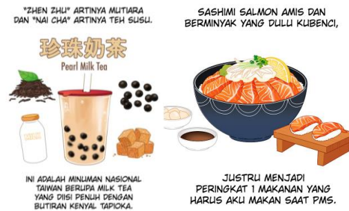
Gambar 7. Detail ilustrasi makanan pada webtoon “ Mukbang Life ”

tersebut, karena pada setiap episode dalam webtoon “ Mukbang Life ” membahas jenis-jenis makanan yang berbeda.