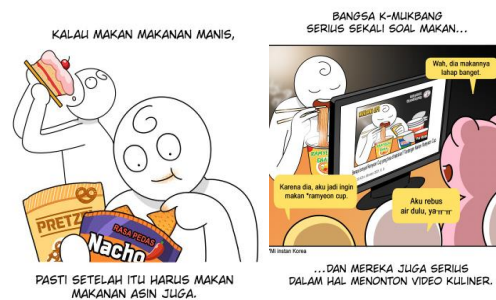
Gambar 6. Detail tipografi pada webtoon "Mukbang Life"

mengetahui bahwa hal itu merupakan komentar dari orang-orang tetapi Hong-kki masih memperhatikan jenis font yang digunakan agar mirip dengan bubble teks pada umumnya, penggunaan tipografi yang terdapat pada webtoon "Mukbang Life" cukup diperhatikan oleh Hong-kki seperti font yang digunakan dipilih sebaik mungkin agar dapat mendukung isi dari cerita yang ingin disampaikan.