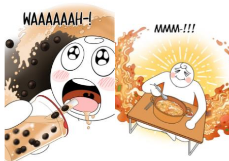
Gambar 5. Ekspresi wajah karakter webtoon “ Mukbang Life ” (Sumber: Hong-kki, 2022)

disantap juga sangat mendukung suasana dan menjelaskan dengan baik apa yang ingin ditunjukkan oleh Hong-kki. Penggambaran detail dan juga ekspresi seperti ini dapat membuat pembaca ikut membayangkan dan memosisikan dirinya sendiri ketika sedang menyantap makanan-makanan tersebut. Penggunaan warna pada minuman pearl milk tea dan juga bubur ramyeon dibuat semirip mungkin dengan bentuk aslinya. Penyusunan layout pada ilustrasi seperti memiliki peran penting karena bisa dilihat dari ilustrasi di bawah dapat menjadi sebuah penggambaran yang menarik yang terlihat tidak padat meskipun dibuat hampir penuh seperti pada ilustrasi pearl milk tea , dan posisi Hong-kki ketika sedang menyantap bubur ramyeon dibuat dalam perspektif dilihat dari atas yang menggambarkan bahwa Hong-kki sedang menyantap makanan sambil duduk di permukaan lantai, kemudian dikelilingi oleh kuah dari bubur ramyeon yang sedang disantap, meskipun ilustrasi dibuat detail dan ramai tetapi tidak padat dan masih menyisakan white space sehingga tetap nyaman saat dibaca.