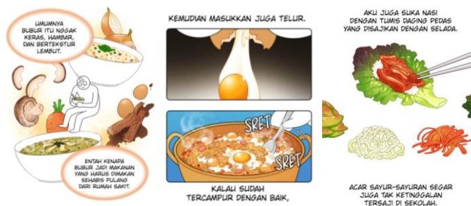
Gambar 4. Desain ilustrasi tips makanan dari webtoon " Mukbang Life " (Sumber: Hong-kki, 2022)

Pada webtoon " Mukbang Life " juga digambarkan persepsi dan berbagai tips yang dilakukan karakter utama ketika sedang menyantap berbagai jenis makanan, tips ketika sedang memasak atau menyantap makanan apa pun yang diilustrasikan secara detail agar pesan dalam cerita dapat tersampaikan dengan baik. Seperti pada bagian gambar bubur abalone yang merupakan salah satu persepsi Hong-kki yang berpikiran bahwa ketika sehabis pulang dari rumah sakit harus memakan bubur. Juga ilustrasi bagaimana cara Hong-kki memasak bubur ramyeon . Dan ilustrasi bagaimana cara Hong-kki menyantap makanan nasi dengan daging pedas yang dibungkus dengan selada dan ditambah dengan beberapa jenis acar. Penggunaan layout pada webtoon " Mukbang Life " memiliki peran yang penting karena dengan ilustrasi yang di layout dalam tiap episodenya selain bertujuan untuk mendukung pesan dalam cerita, juga membantu pembaca agar dapat menikmati alur cerita dengan nyaman, dilihat dari penyusunan layout cerita dibuat tidak terlalu padat dan masih terdapat white space agar ilustrasi dalam cerita terlihat lebih baik dan terorganisir.