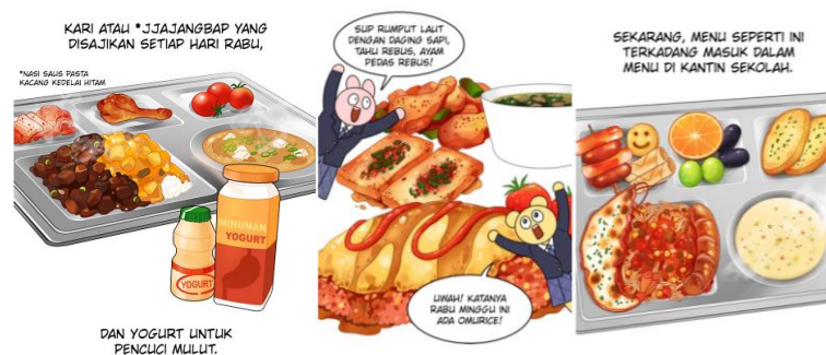
Gambar 3. Desain Ilustrasi makanan webtoon “ Mukbang Life ” (Sumber: Hong-kki, 2022)