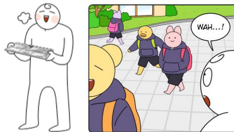
Gambar 2. Desain karakter webtoon “ Mukbang Life ”

Desain ilustrasi pada karakter utama Hong-kki dibuat dengan sangat sederhana, hanya menggunakan garis yang membentuk sebuah karakter dan diberi warna putih, tetapi secara bentuknya masih terlihat bahwa karakter tersebut memiliki proporsi tubuh seorang manusia. Berbanding terbalik dengan ilustrasi dari makanan yang dibuat sedetail mungkin. Hal tersebut bertujuan agar fokus utama pada webtoon ini ditujukan untuk makanan yang diceritakan pada webtoon “ Mukbang Life ”. Terlihat juga pada karakter manusia lainnya yang dibuat sederhana dan tidak menyerupai manusia pada umumnya, memiliki proporsi badan seorang manusia tetapi pada bagian kepala dibuat seperti kelinci, bebek, juga beruang.