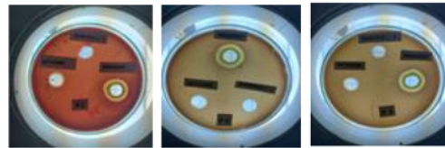
Gambar 1 Diameter zona hambat CHX 0,12% dan CPC 0,1% dengan Povidone Iodine 1% terhadap P. gingivalis

Pada penelitian ini digunakan satu cawan petri berisi media agar darah yang telah dikultur bakteri pada setiap pengulangan. Pada cawan petri diberi perlakuan obat kumur yang mengandung CHX 0,12% dan CPC 0,1% dengan obat kumur yang mengandung povidone iodine 1%, dan kontrol negatif akuades yang diperkirakan akan menghasilkan zona hambat. Setelah itu diinkubasi dengan suhu 37°C selama 24 jam pada inkubator. Pengukuran yang digunakan dalam penelitian ini adalah besarnya diameter zona hambat pertumbuhan bakteri yang diberi tiga perlakuan dan diukur menggunakan jangka sorong. Zona hambat merupakan zona bening yang terbentuk di sekitar lubang sumuran, pada zona ini tidak terdapat pertumbuhan bakteri (Gbr. 1).