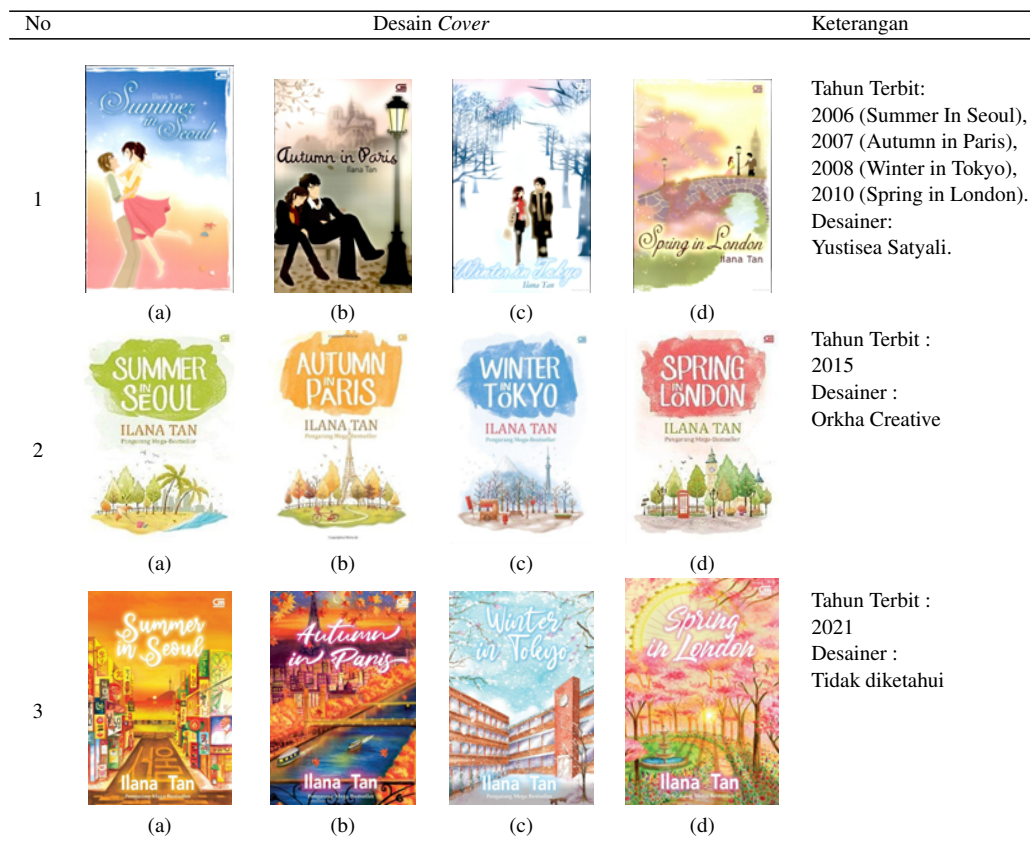
Tabel 1. Desain Sampul Tiga Edisi

Analisis didahului dengan penyajian data dalam bentuk Tabel 1 berdasarkan urutan pembuatan cover novel yaitu berisi analisis desain cover novel terbitan tahun pertama yaitu tahun 2006 untuk novel Summer in Seoul , 2007 novel Autumn in Paris , 2008 novel Winter in Tokyo , dan 2010 novel Spring in London . Pembaruan desain cover novel pertama kali di tahun 2015. Pembaruan desain cover novel kedua tahun 2021. Analisis tiap desain dibagi dalam tiga paragraf di bawah.