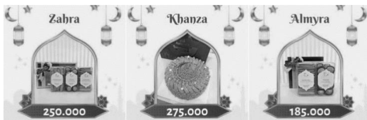
Gambar 4.7. Produk-produk Eid Hampers 2023 Eclat Patissier & Café

Eclat menghasilkan roti dengan menggunakan bahan-bahan terbaik, menciptakan produk yang lebih sehat dibandingkan dengan roti konvensional lainnya. Selain itu, Eclat menerima pesanan kue khusus yang dibuat sesuai dengan keinginan pelanggan. Riyan, pemilik Eclat, fokus utamanya adalah pada pemasaran untuk memperkuat citra merek Eclat di kalangan masyarakat. Pihak Eclat juga menyediakan produk hampers yang disesuaikan dengan perayaan-perayaan nasional, seperti Tahun Baru Imlek dan Lebaran.