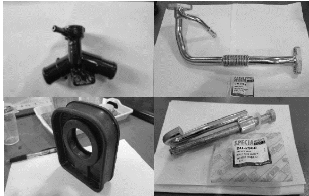
Gambar 4.4. Produk-produk SPECIA; a. Pipa Olie Cooler Hino; b. Karet Kopel Mobi Colt Diesel Truck; c. Water Outlet; d. Baut Ban Serep Honda Mobilio.