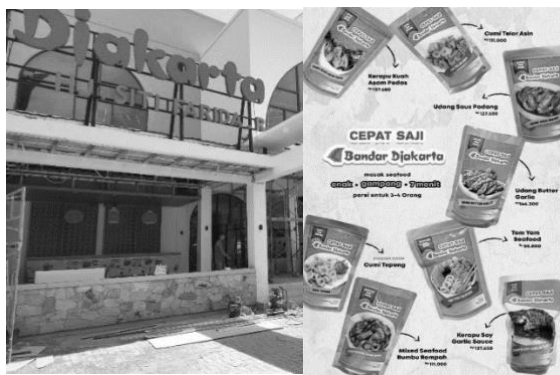
Gambar 4.8. Bandar Djakarta Cirebon, produk cepat saji Bandar Djakarta Cirebon.

Bandar Djakarta Cirebon berdiri sejak Agustus 2022, merupakan rumah makan seafood ternama. Didirikan dengan kerjasama antara Bandar Djakarta dan keluarga Riyan, dan Riyan berfokus pada bidang marketing atau pemasaran. Dalam menjaga hubungan dengan pelanggan, strategi yang sering digunakan ialah dengan cara memberikan produk sampel untuk pelanggan, sehingga pelanggan merasa senang dengan produk dan akhirnya akan melakukan pembelian produk lagi. Bandar Djakarta juga mempunyai produk cepat saji yang ditujukan pada pelanggan yang datang dari luar kota Cirebon, supaya produk tersebut bisa dijadikan buah tangan.