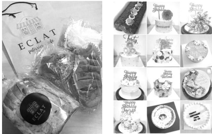
Gambar 4.6. Roti dan Kue Eclat Patissier & Café

Eclat menghasilkan roti dengan menggunakan bahan-bahan terbaik, menciptakan produk yang lebih sehat dibandingkan dengan roti konvensional lainnya. Selain itu, Eclat menerima pesanan kue khusus yang dibuat sesuai dengan keinginan pelanggan. Riyan, pemilik Eclat, fokus utamanya adalah pada pemasaran untuk memperkuat citra merek Eclat di kalangan masyarakat. Pihak Eclat juga menyediakan produk hampers yang disesuaikan dengan perayaan-perayaan nasional, seperti Tahun Baru Imlek dan Lebaran.