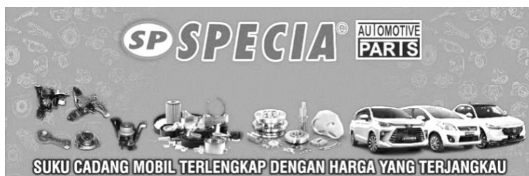
Gambar 4.3. Logo dan Moto SPECIA.