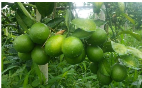
Gambar 1. Jeruk lemon

Penelitian ini merupakan eksperimental laboratorium secara in vitro dengan metode broth microdilution untuk menentukan KHM dan KBM. Sampel penelitian ini ialah Porphyromonas gingivalis ATCC (American Type Culture Cell) 33277 yang berasal dari Laboratorium Mikrobiologi Universitas Padjajaran Bandung. Kulit jeruk lemon yang berasal dari buah lemon lokal berwarna hijau, dengan umur tanaman 1,5 tahun yang didapatkan dari Perkebunan Padepokan Pandawa Lima Cibodas–Maribaya Kabupaten Bandung Barat Jawa Barat. Determinasi dilakukan di Laboratorium Biologi Universitas Padjajaran Bandung (Gambar 1).