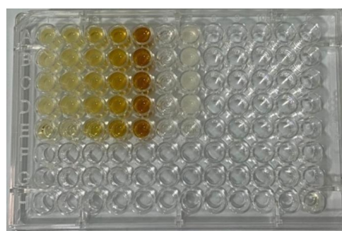
Gambar 2. Terdapat 96 well plate uji KHM dan KBM Porphyromonas gingivalis

Tabel 2 menyajikan hasil pengujian pengukuran absorbansi medium. Konsentrasi 0,625%, 1,25%, 2,5% memiliki kekeruhan yang sama dan bersifat menghambat pertumbuhan bakteri karena masih terlihat pertumbuhan koloni bakteri patogen periodontal Porphyromonas gingivalis .