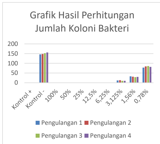
Grafik 1 Hasil Perhitungan Jumlah Koloni Bakteri

Interpretasi aktivitas antibakteri air perasan jeruk nipis dilakukan dengan cara membandingkan penurunan jumlah koloni bakteri yang diberi perlakuan senyawa antibakteri dari air perasan jeruk nipis terhadap jumlah koloni bakteri awal.