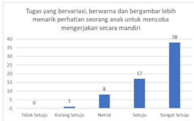
Diagram di atas menunjukkan bahwa 38 responden dari 64 responden sangat setuju bahwa tugas yang bervariasi, berwarna dan bergambar lebih menarik perhatian seorang anak untuk mencoba mengerjakan secara mandiri.