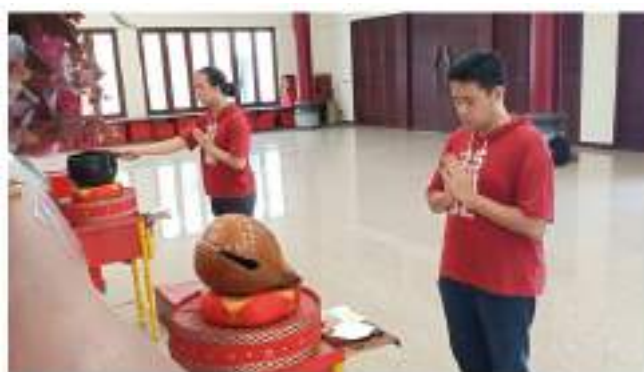
Gambar 5. Tampilan kamera 1.

Kamera 1 menggunakan handphone Oppo F9. Hal ini digunakan untuk membandingkan kualitas video sekaligus menjadi alternatif pengambilan gambar di kemudian hari. Selama pengambilan gambar berlangsung, kamera pada handphone Oppo F9 mengalami auto focus yang membuat kejernihan gambar berubah-ubah. Sehingga untuk lebih baik di kemudian hari, jika memungkinkan, auto focus pada kamera handphone dapat di non-aktifkan atau menggunakan mode yang lain. Pengambilan gambar pada kamera 1 memberikan gambaran jelas pemimpin kebaktian dengan posisi pemegang alat kebaktian Mu Yi. Hasil pengambilan gambar pada kamera 1 ditunjukkan pada gambar 5.