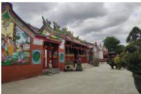
Gambar 3. Kegiatan kunjungan dan observasi ke Vihara Buddha Gaya.

Observasi Altar (Tempat Ibadah) Vihara Buddha Gaya. Pada kegiatan ini, perwakilan dosen bersama dengan mahasiswa melakukan observasi pada Vihara Buddha Gaya seperti pada gambar 3. Kegiatan ini bertujuan untuk mensurvei lokasi pengambilan gambar, bereksperimen dalam pengambilan gambar beserta perkiraan posisi pemimpin kebaktian, test pengambilan gambar, mengukur jarak pengambilan gambar beserta dengan cakupan kamera dan mengukur pencahayaan yang dibutuhkan dengan fasilitas yang tersedia.