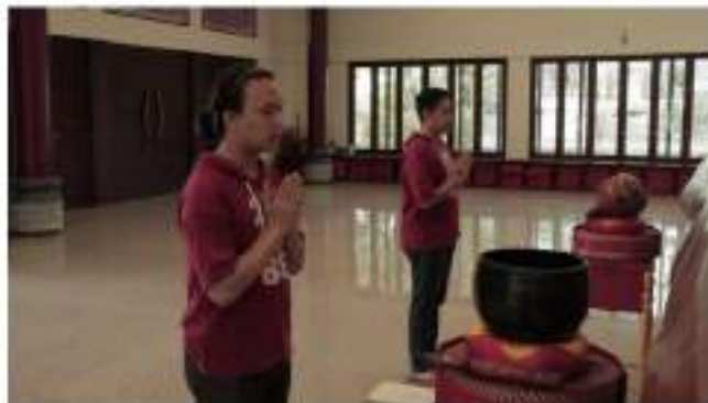
Gambar 7. Tampilan kamera 3

Kamera 3 menggunakan kamera Canon EOS 800D menggunakan lensa kit 18-55 mm. Kamera ini menjadi alternatif kamera yang baik dalam pengambilan gambar. Dikarenakan hasilnya baik untuk dapat dinikmati. Maksud dari penempatan kamera ini adalah memberikan gambaran jelas dari gerak tubuh pemimpin kebaktian khususnya pemegang alat kebaktian Ta Ching. Pemegang alat kebaktian ini sekaligus menjadi pemimpin kebaktian utama dalam pelaksanaan kebaktian. Sehingga dengan menaruh posisi kamera ini dapat menggambarkan kegiatan memimpin kebaktian dengan lebih jelas. Hasil pengambilan gambar pada kamera 3 ditunjukkan pada gambar 7.