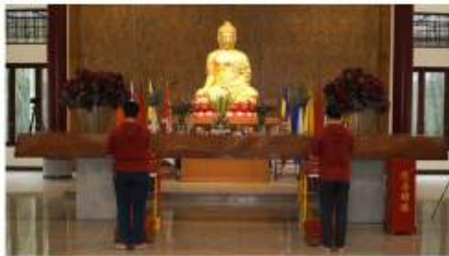
Gambar 6. Tampilan kamera 2

Kamera 3 menggunakan kamera Canon EOS 800D menggunakan lensa kit 18-55 mm. Kamera ini menjadi alternatif kamera yang baik dalam pengambilan gambar. Dikarenakan hasilnya baik untuk dapat dinikmati. Maksud dari penempatan kamera ini adalah memberikan gambaran jelas dari gerak tubuh pemimpin kebaktian khususnya pemegang alat kebaktian Ta Ching. Pemegang alat kebaktian ini sekaligus menjadi pemimpin kebaktian utama dalam pelaksanaan kebaktian. Sehingga dengan menaruh posisi kamera ini dapat menggambarkan kegiatan memimpin kebaktian dengan lebih jelas. Hasil pengambilan gambar pada kamera 3 ditunjukkan pada gambar 7.