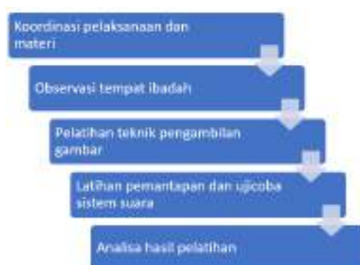
Gambar 1. Tahapan kegiatan pelaksanaan pengabdian.

Pada realisasi kegiatan pengabdian masyarakat Teknik Pengambilan Gambar Video Kebaktian Umum Daring Di Vihara Buddha Gaya, mengalami kendala pada akses kunjungan Vihara. Hal ini terjadi dikarenakan adanya peraturan pemerintah dalam Pemberlakuan Pembatasan Kegiatan Masyarakat (PPKM) pada 25 Juni 2021. Saat ini kegiatan-kegiatan secara daring yang sudah banyak digunakan dalam rangka pengabdian pada masyarakat yang dilakukan oleh berbagai perguruan tinggi (Arief et al., 2021).