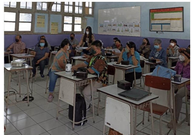
Gambar 4. Foto Peserta Penyuluhan dan Panitia

Peserta penyuluhan mengikuti kegiatan sampai akhir dan mereka berharap di masa yang akan datang tetap mendapat bimbingan dari tim pengabdian agar kemajuan guru-guru untuk membimbing siswa TK dan SD ini lebih baik lagi.