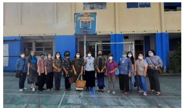
Gambar 5. Foto Tim Pengabdian