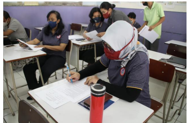
Gambar 3. Foto Pengisian Kuesioner

Gambar 3 adalah foto peserta ketika mengisi kuesioner yang bertujuan mengetahui pemahaman peserta penyuluhan tentang materi yang telah disampaikan oleh narasumber. Masing-masing peserta menduduki meja dan bangku masing-masing, sehingga hasil kuesioner adalah benar-benar pemikiran masing-masing peserta, jika peserta tidak jelas memahami soal yang diberikan, maka peserta dapat bertanya pada tim pengabdian.