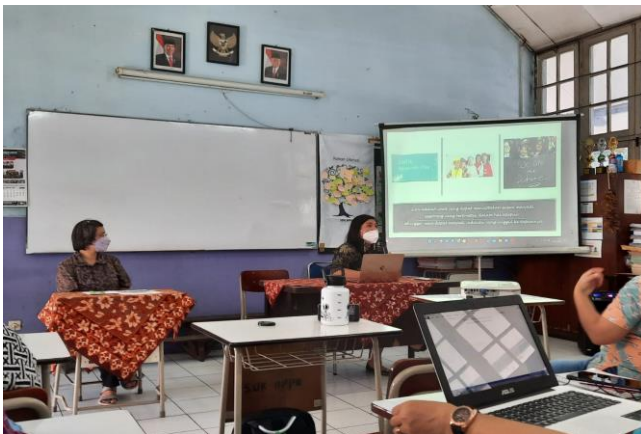
Gambar 2. Foto Narasumber dan Moderator

Foto-foto saat kegiatan penyuluhan berlangsung diperlihatkan dalam Gambar 2 sampai Gambar 5. Pada Gambar 2 diperlihatkan penyuluhan oleh narasumber dan dibantu oleh moderator.