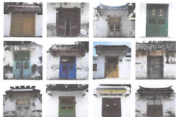
Gambar 6. Berbagai Desain Gerbang Rumah Peranakan, Lasem di Soditan (atas), Karangturi (tengah), dan Babagan (bawah).