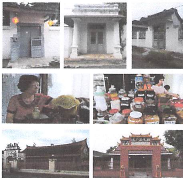
Gambar 3. Komponen Umum Kawasan Pecinan: Perumahan, Pasar dan Klenteng

tertentu. Penulis memiliki persepsi sendiri tentang gerbang rumah Peranakan di tiga daerah Pecinan, Lasem.