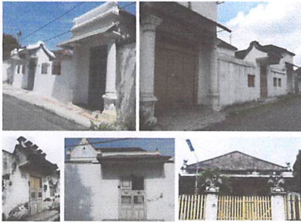
Gambar 5. Contoh Nilai Tangible : Budaya Belanda: Gerbang Rumah Peranakan, Lasem Di kawasan Karangturi (atas) dan Babagan (bawah).

Mengalami tiga kawasan Pecinan berulang kali memberikan pemahaman yang lebih dalam tentang nilai-nilai penting yang terkandung di dalamnya. Suasana menciptakan "imajinasi puitis" yang sangat memengaruhi perasaan; rasa bangga, sedih dan marah ketika saya melihat keadaan dan kondisi gerbang-gerbang tersebut. Penulis bangga dengan kekayaan sejarah dan budaya, sedih karena banyak yang dilupakan, dan marah karena karakter unik dari gerbang tampaknya ter/diabaikan. Bahkan, Pallasmaa dalam Steven Holl (1994) mengungkapkannya lebih puitis dengan berpendapat bahwa keadaan, kewujudan arsitektur lebih lengkap dari bentuk seni lainnya dan dapat mempengaruhi persepsi sensorik seseorang.