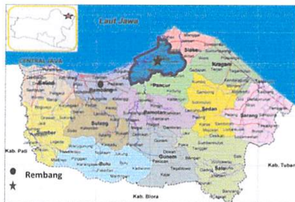
Gambar 2. Lokasi Rembang dan Kecamatan Lasem, Jawa tengah

Kota ini akan memberikan pengalaman berwisata dalam kesederhanaan namun dipenuhi dengan kekayaan cerita sejarah dan budayanya.