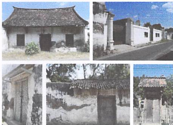
Gambar 1. Berbagai Kerusakan Gerbang dan Rumah Peranakan Tionghoa di Lasem, Jawa tengah

karena itu dapat memberikan arti tersendiri terhadap gerbang.