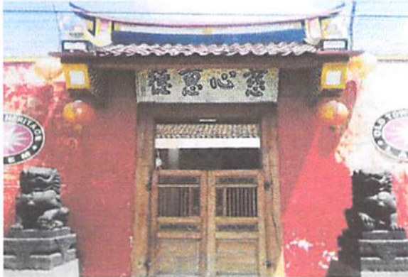
Gambar 7. Dekorasi Cenderung Ramai pada Gerbang Rumah Peranakan Lasem.

Meskipun berasal dari masa lalu, gerbang-gerbang ini mengambil bagian hingga hari ini. Mereka tidak hanya penuh dengan cerita sejarah dan budaya, tetapi juga sebagai bagian dari sebuah karya seni. Bahkan, secara tidak langsung, sebuah karya yang memiliki nilai tidak berwujud akan lebih mudah bertahan hidup seiring berjalannya waktu karena ia memiliki kekuatan untuk menembus periode dan bertahan dari periode klasik ke periode kontemporer. Gerbang paling sering menjadi latar belakang foto gaya kontemporer. Oleh karena itu, dapat dikatakan bahwa keberadaan gerbang berkontribusi terhadap gaya hidup saat ini, dan secara tidak langsung menjadi bagian dari upaya pelestarian budaya.