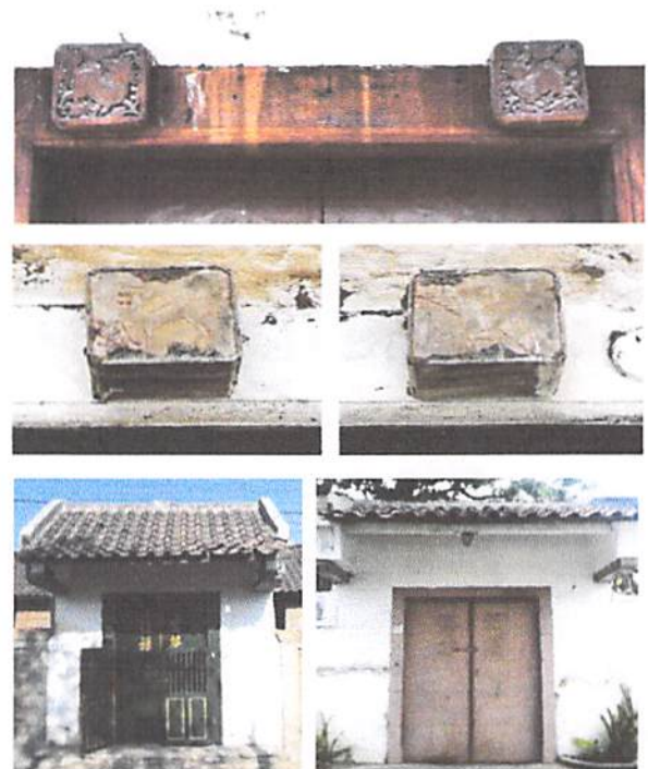
Gambar 4. Contoh Nilai Intangible : Budaya Tionghoa-Gerbang Rumah Peranakan, Lasem. Kilin (atas), Rusa dan Bangau (tengah) & Tulisan Hanzi (bawah)