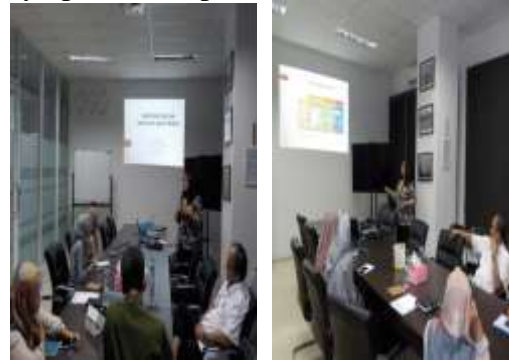
Gambar 3. Sesi Mengelola dan Menyiapkan Dana Pensiun

setiap tahunnya. Mempersiapkan dana pensiun dapat dilakukan melalui investasi dan wirausaha. Gambar 3 menunjukkan sesi pemaparan materi mengelola dan menyiapkan dana pensiun.