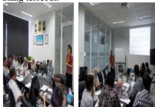
Gambar 1. Sesi Mengelola Utang