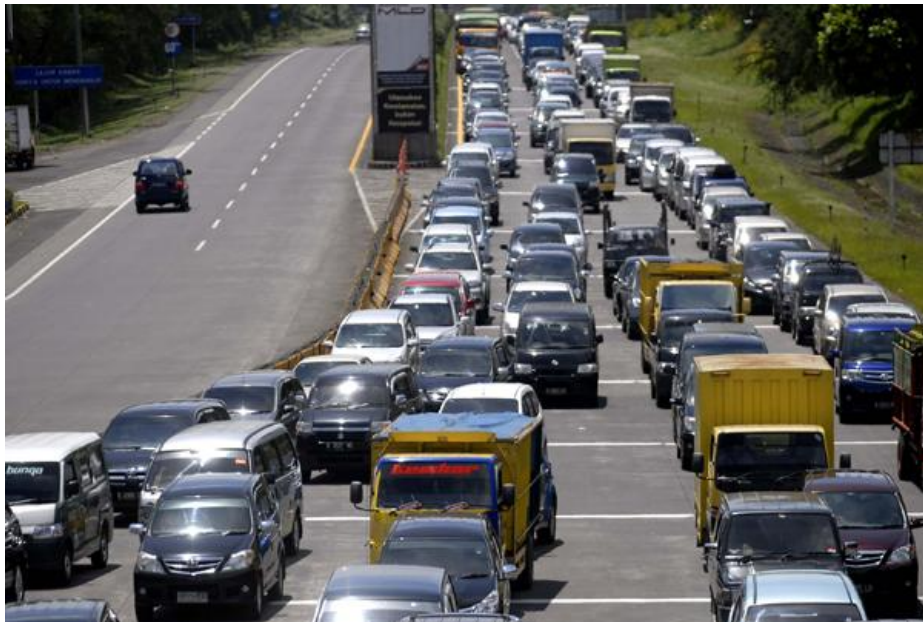
Gambar 1.4 Antrian Panjang di Gerbang Keluar Tol Pasteur