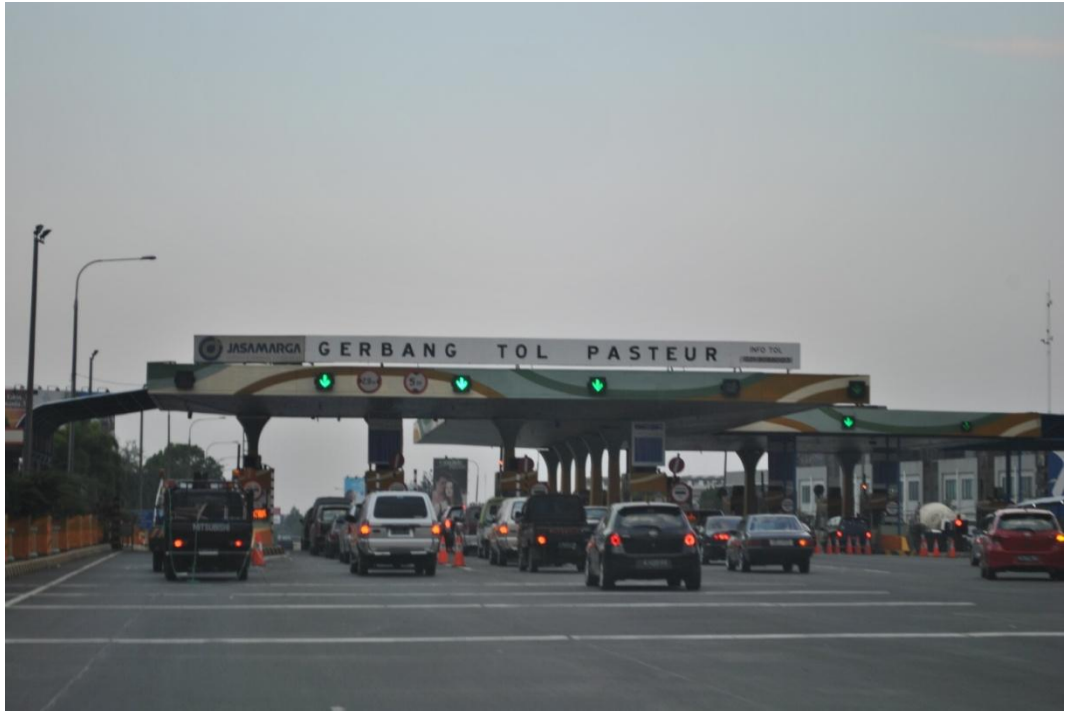
Gambar 1.3 Antrian di Gerbang Keluar Tol Pasteur