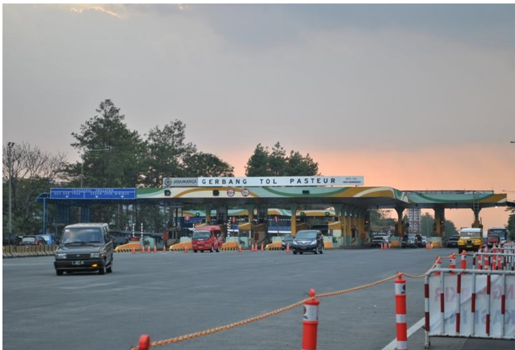
Gambar 1.2 Gerbang Keluar Tol Pasteur