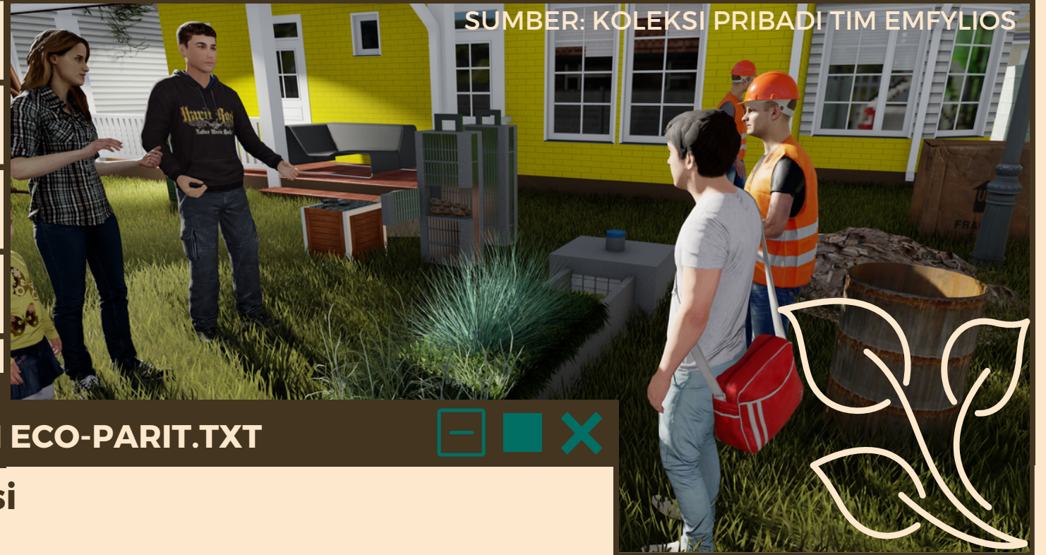
TAMPAK 3D ECO-PARIT (3).JPG