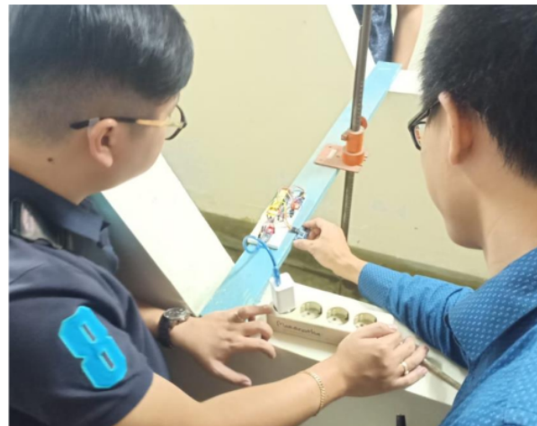
Gambar 6 Pembacaan dengan Alat Ukur Digital