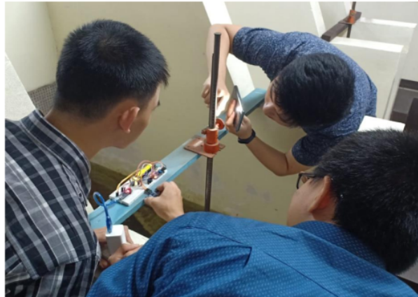
Gambar 5 Pembacaan dengan Alat Ukur Manual

duga air atau yang biasa disebut peilschaal di banyak tempat di saluran-saluran irigasi. Meteran taraf seperti pada Gambar 5 lebih banyak digunakan di laboratorium penelitian atau untuk kegiatan akademik. Sistem digital di pengelolaan jaringan irigasi sendiri secara bertahap sudah dilakukan antara lain dengan adanya beberapa pintu air otomatis untuk mengatur debit aliran yang dibutuhkan. Oleh karena itu, e-peilschaal seperti Gambar 6 dibuat sederhana dengan tetap memiliki keakurasian yang tinggi untuk menggantikan papan duga air yang masih digunakan di waktu mendatang.