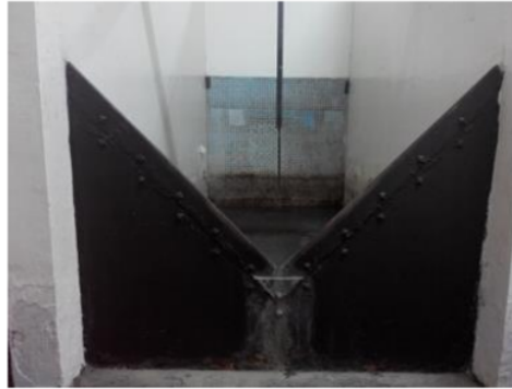
Gambar 4 Tampak Depan Alat Ukur Thomson