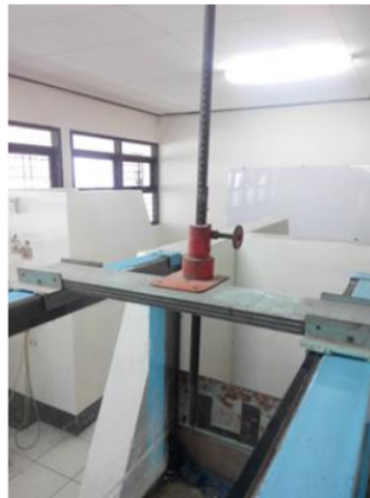
Gambar 3 Meteran Taraf

Penelitian ini telah dilakukan dengan melakukan percobaan pada saluran terbuka untuk mengambil data tinggi muka air dengan menggunakan meteran taraf yang bersifat manual/konvensional. Adapaun alat-alat utama yang digunakan lainnya adalah meteran taraf atau biasa disebut peilschaal seperti pada Gambar 3 dan alat ukur debit aliran Thomson pada Gambar 4. Alat percobaan lainnya adalah pompa air dan saluran terbuka itu sendiri.