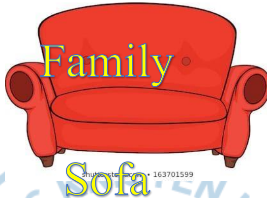
Gambar 1.2 Logo Toko Family Sofa