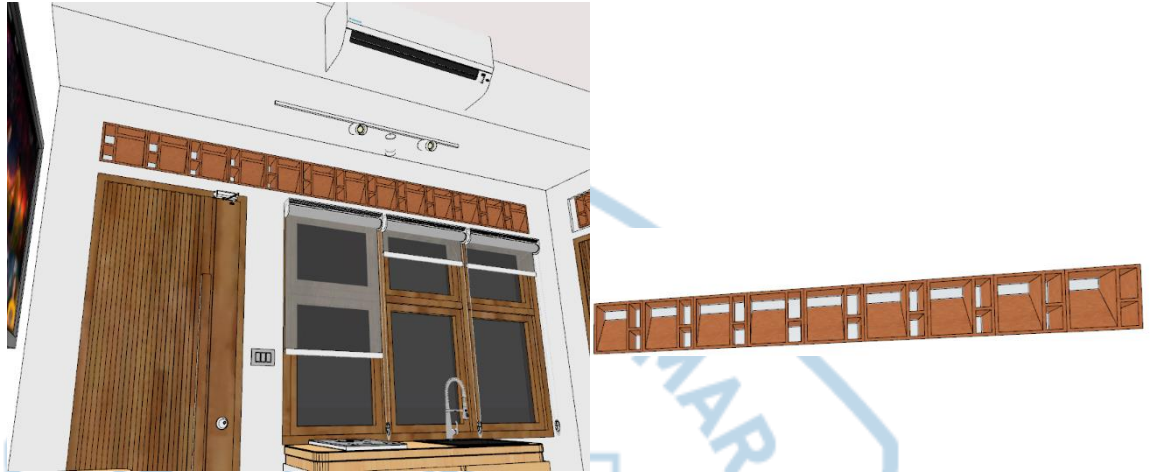
Gambar 6.10 Rancangan ventilasi, jendela, AC dan lampu