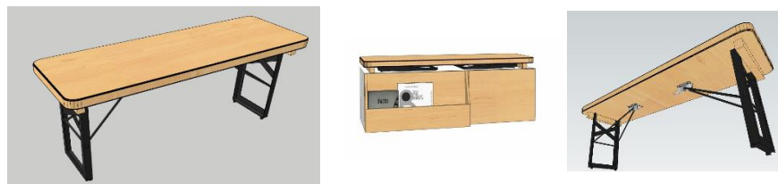
Gambar 6.3 Kursi kamar kos