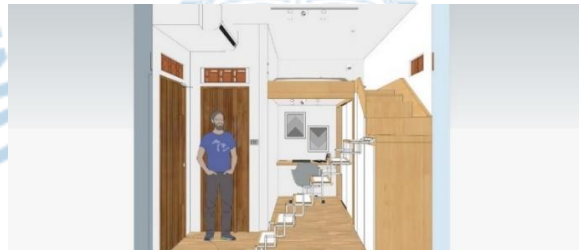
Gambar 6.2 Rancangan kamar kos (II)