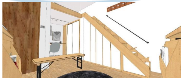
Gambar 6.9 Rancangan warna