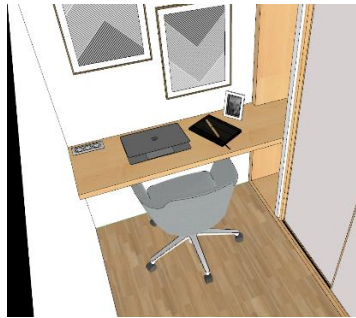
Gambar 6.4 Rancangan meja