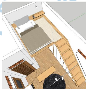
Gambar 6.6 Rancangan tempat tidur