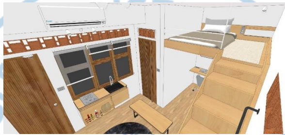
Gambar 6.1 Rancangan kamar kos (I)