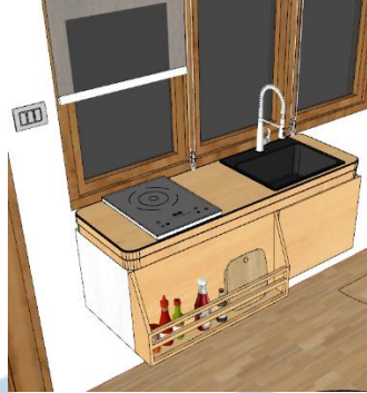
Gambar 6.7 Rancangan tempat masak