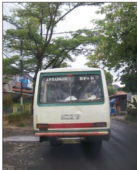
Tampak Belakang Dari Bus Kobutri dengan Jumlah Roda 4 Buah ( 2 di depan dan 2 di belakang )