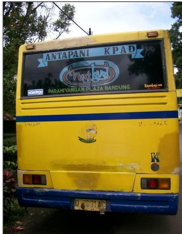
Tampak Belakang Bus KOBUTRI Baru