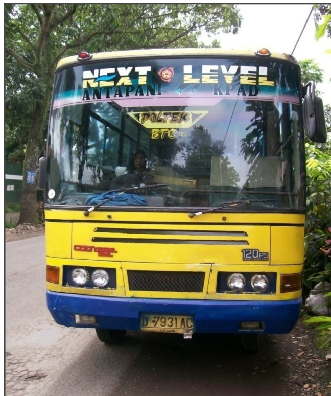
Tampilan Bus KOBUTRI Baru Lebih Baik