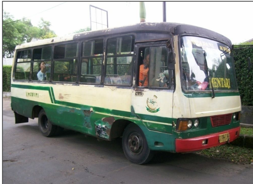
Bus Kobutri dengan Dimensi Panjang 6 m, Lebar 1,6 m dan Tinggi 2,5 m. Kapasitas Bus Kobutri 25 Penumpang Duduk dan 20 Penumpang Berdiri.