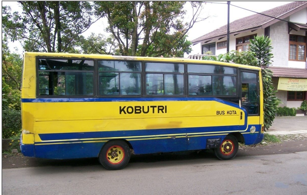
Tampak Samping Bus KOBUTRI Baru