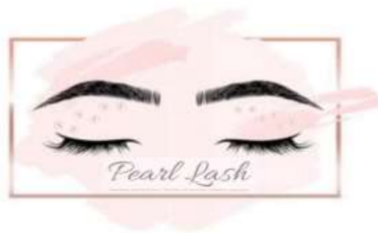
Gambar 1. 2 Logo Lash Beauty