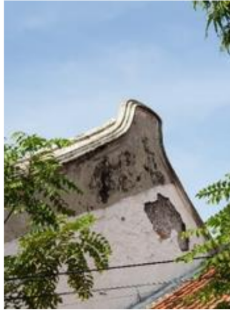
Gambar 9. Dinding Pemikul Segitiga

dinding pemikul berbentuk segitiga sebagai pembatas kiri dan kanan bangunan. Bagian jurai memiliki bentuk yang khas menyerupai daun cemara atau ekor burung walet yang mengarah ke atas.