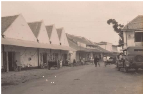
Gambar 1. Pecinan Indramayu 1937

Penelitian ini bertujuan melakukan pemetaan bangunan dengan pengaruh budaya Belanda dan Tionghoa khususnya pada kawasan Pecinan Kota Indramayu dan mengidentifikasi kondisi bangunan bersejarah saat ini untuk mengklarifikasi seberapa banyak pengaruh budaya Tionghoa yang ada di Kawasan Pecinan Indramayu.