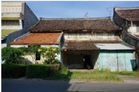
Gambar 3. Rumah Tinggal Pecinan Indramayu

Rumah tinggal ini dibangun pada tahun 1880, berada pada Jalan Cimanuk, Pecinan Kota Indramayu. Masih berfungsi sebagai rumah tinggal dan ditempati oleh generasi paling muda. Seperti tolok ukur arsitektur Tionghoa maka rumah tinggal ini memiliki kriteria Arsitektur Tionghoa, dapat dilihat sebagai berikut: