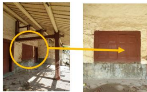
Gambar 14. Aplikasi Wama Merah pada Kolom, Kuda-kuda, Pintu dan Jendela

Dilihat dari bentuk jendela lebar yang ada di lantai 1, diduga rumah ini dulu berfungsi juga sebagai tempat usaha.