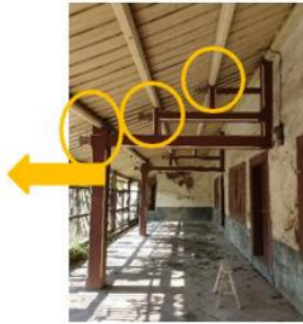
Gambar 11. Kontruksi Kuda-kuda Teras Lantai 1

Kuda-kuda dibuat sederhana tanpa konstruksi tou kung pada bagian atas kolom seperti rumah Tionghoa pada umumnya. Akan tetapi rumah ini memiliki ornamen bunga lotus yang awalnya kuncup dan semakin ke bawah semakin mekar. Bunga Lotus adalah simbol dari kemurnian dan kesempurnaan. Bunga ini tumbuh di lumpur tapi tidak tercemar, sama seperti Budha yang lahir di dunia namun hidupnya mengatasi dunia dan disebutkan bahwa buah Lotus akan menjadi matang saat bunganya mekar, sama seperti kebenaran yang diajarkan oleh Budha segera menghasilkan buah pencerahan. Bunga Lotus juga melambangkan musim panas dan berbuah (Williams, 1976:257).