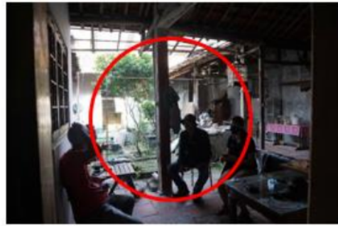
Gambar 4. Courtyard Rumah Tinggal Pecinan Indramayu