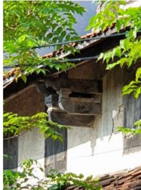
Gambar 13. Konstruksi Tou Kung Penyangga Teritisan Lantai 2

Konstruksi tou kung sederhana ditemukan pada penyangga atap teritisan lantai 2 berupa lengan kantilever pendek.