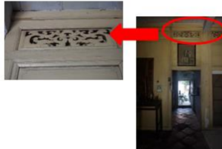
Gambar 5. Ragam Hias Pada Boventlict Rumah Tinggal Pecinan Indramayu

Rumah tinggal ini memiliki courtyard (lihat Gambar 4) pada bagian tengah rumah saat ini masih dipertahankan sebagaimana fungsinya seperti dahulu yaitu sebagai sirkulasi udara dan pencahayaan.