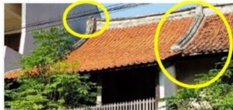
Gambar 10. Jurai Atap Seperti Ekor Burung Walet