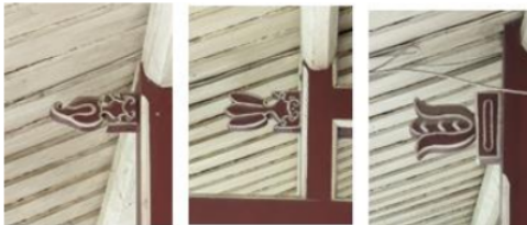
Gambar 12. Ornamen Bunga Lotus Pada Konstruksi tou kung

Kuda-kuda dibuat sederhana tanpa konstruksi tou kung pada bagian atas kolom seperti rumah Tionghoa pada umumnya. Akan tetapi rumah ini memiliki ornamen bunga lotus yang awalnya kuncup dan semakin ke bawah semakin mekar. Bunga Lotus adalah simbol dari kemurnian dan kesempurnaan. Bunga ini tumbuh di lumpur tapi tidak tercemar, sama seperti Budha yang lahir di dunia namun hidupnya mengatasi dunia dan disebutkan bahwa buah Lotus akan menjadi matang saat bunganya mekar, sama seperti kebenaran yang diajarkan oleh Budha segera menghasilkan buah pencerahan. Bunga Lotus juga melambangkan musim panas dan berbuah (Williams, 1976:257).