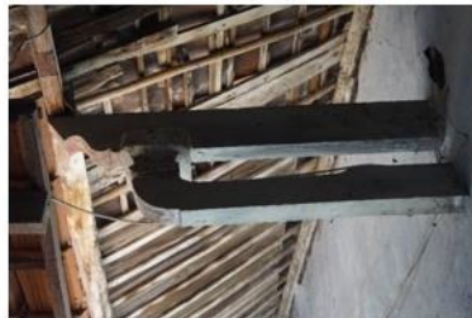
Gambar 6. dou gong Rumah Tinggal Pecinan Indramayu

Struktur terbuka yang merupakan konstruksi konsol penopang rangka atap disertai ragam hias yang disebut dou gong dengan tipe Fukien selalu ada pada setiap arsitektur Tionghoa.