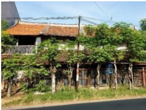
Gambar 8. Fasade Rumah tinggal No.10

Rumah tinggal ini dibangun pada tahun 1870, berada pada Jalan Cimanuk, Pecinan Kota Indramayu. Awalnya berfungsi sebagai rumah tinggal dan tempat usaha, saat ini hanya berfungsi sebagai rumah tinggal dan ditempati oleh generasi muda saat ini.