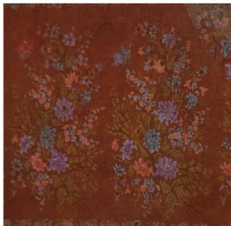
Gambar 3. Batik Tiga Negeri Buketan Lili Latar Ganggeng