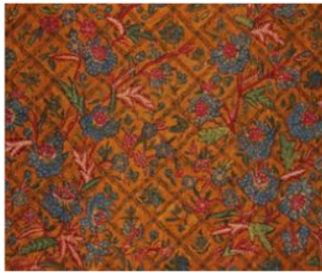
Gambar 1. Batik Tiga Negeri Keluarga Tjoa