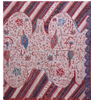
Gambar 4. Batik Tiga Negeri Pelo Ati