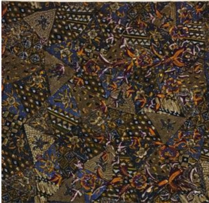
Gambar 5. Batik Tiga Negeri Cikalan