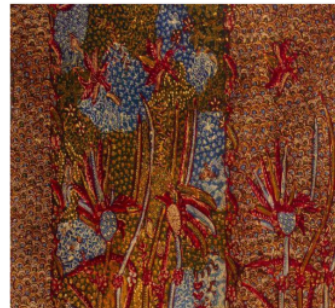
Gambar 2. Batik Tiga Negeri Gunung Ringgit Pring