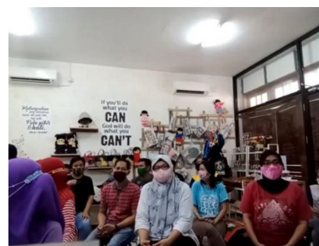
Gambar 2: Suasana Para peserta mengikuti Pelatihan

Selain itu, Kegiatan ini pun juga dijadikan sebagai momen berbagi pengalaman. Para peserta menggunakan kesempatan