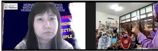
Gambar 3: Saudari N sedang membagikan pengalamannya melalui Bahasa isyarat kepada peserta dan Trainer melalui Platform Zoom

tersebut untuk menceritakan pengalamannya sebagai penyandang disabilitas yang mau berjuang.