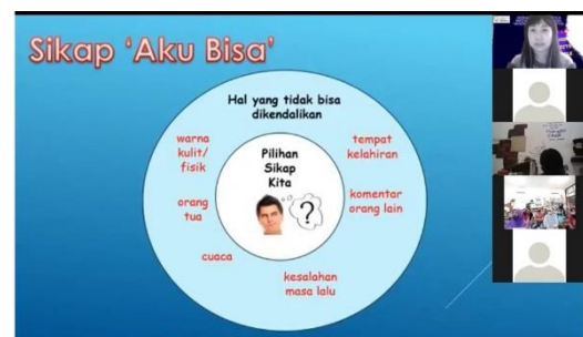
Gambar 1: Pelaksanaan Pelatihan melalui Platform Zoom.

Beberapa contohnya seperti menjadi pribadi yang memiliki sikap "aku bisa" atau "pribadi pemenang" yang dapat diaplikasikan saat menghadapi berbagai kondisi untuk menentukan sikap, mencari solusi, dan bertindak dalam bekerja. Selain itu, para peserta juga diharapkan memiliki tujuan hidup dengan cara mengetahui talenta yang dimiliki.