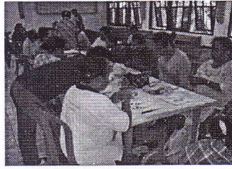
Peserta workshop Pernak Pernik