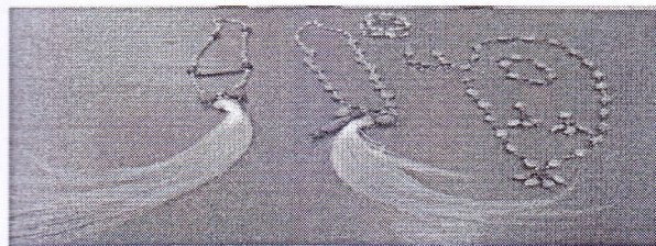
Kalung dan Gelang Biji Rotan, Gelang Biji Asiawa, Biji Akyof, dan Bulu Burung Cendrawasih dan Bambu

semangat. Penjualan produk peserta dilakukan dan diakhiri dengan evaluasi peserta dan pelatih. Ikut hadir dan meramaikan acara tersebut tamu undangan yang adalah masyarakat di sekitar pelatihan, anggota gereja setempat, dan perwakilan gereja GKI di Biak Selatan, serta wakil pemerintah. Sekalipun pelatihan workshop yang diberikan sudah lama berlangsung, manfaatnya sampai saat ini masih dirasakan oleh para perempuan Biak Selatan. Keterampilan dasar yang telah mereka dapatkan ternyata terus mereka kembangkan. Tidak kenal kata berhenti, maka kreativitas terus terasah, bahkan pada masa pandemik mereka semakin memiliki banyak waktu untuk berkarya dan meningkatkan kreativitas mereka. Membuat berbagai bentuk dan klasifikasi harga agar dapat dijangkau oleh semua lapisan masyarakat. Perempuan dengan segala inspirasi dapat berkarya dalam segala situasi senantiasa memiliki solusi dala setiap peristiwa kehidupan.