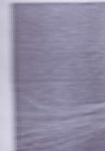
Kalung dan Ge dan B

semangat. Perju dibahini dengan dan meramaikan adilah masyarakat sempat, dan p wakil pemerin diberikan sudah uat ini masih Selatan. Keteran nyyata terus berhenti, maka masa pandemik untuk berkarya Membuat berbag dijungkan oleh ungan segala siliasi senantias kehidupan.