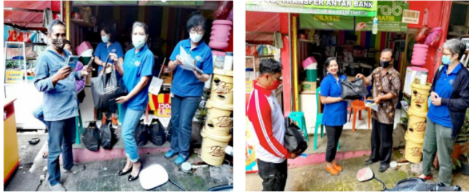
Gambar 1. Penyerahan buku saku protokol kesehatan di dalam angkutan kota, stiker edukasi, masker, dan cendera mata

Kegiatan penyuluhan berupa edukasi penerapan protokol kesehatan di dalam angkutan kota terhadap sopir Kopamas Sarijadi, dimulai dengan membagikan buku saku dan menjelaskan apa itu protokol kesehatan di dalam angkutan umum, alat prokes (protokol kesehatan) bagi sopir dan penumpang dan hal-hal yang perlu diterapkan di dalam angkutan kota (Gambar 1).