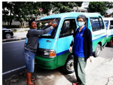
Gambar 3. Pendampingan dalam Penempelan Stiker Edukasi

Tim penyuluh mendampingi para sopir angkutan kota ketika menempel stiker edukasi protokol kesehatan pada era adaptasi kebiasaan baru (Gambar 3).