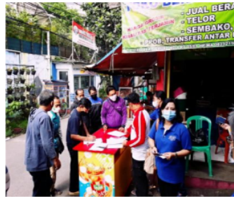
Gambar 2. Pendampingan dalam pengisian kuesioner

Pada saat pengisian kuesioner, tim penyuluh mendampingi para sopir dan menjelaskan maksud butir-butir pertanyaan apabila ada yang tidak dipahami (Gambar 2).