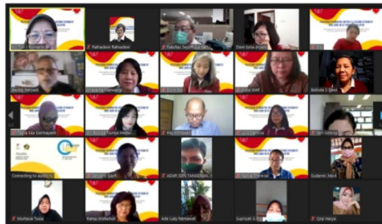
Gambar 3. Kegiatan pelatihan secara daring melalui Zoom Meeting