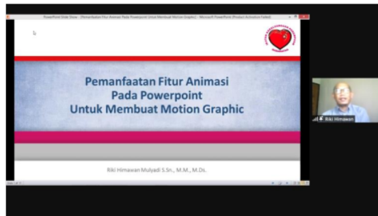
Gambar 2. Pemateri ke-2 Bapak Riki Himawan Mulyadi