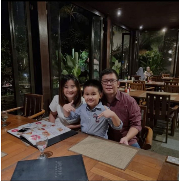
Gambar 1 Foto Bersama Keluarga

perusahaan. Beliau bisa mendapatkan berbagai pengalaman kerja dalam ekosistem perusahaan yang sudah terbangun rapi.