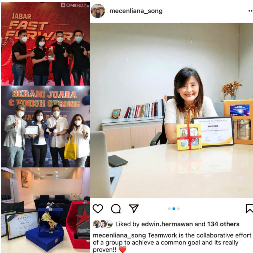
Gambar 2 Penghargaan Karir

Terdapat kutipan dari Albert Einstein yang beliau sukai, "Adalah hal yang gila bila kita mengharapkan hasil yang berbeda dengan melakukan cara yang sama setiap hari". Saat menghadapi "kegagalan"; sesuatu yang buntu, disitu waktunya kita untuk melihat dengan cara pandang yang sehat dan berpikir kreatif.