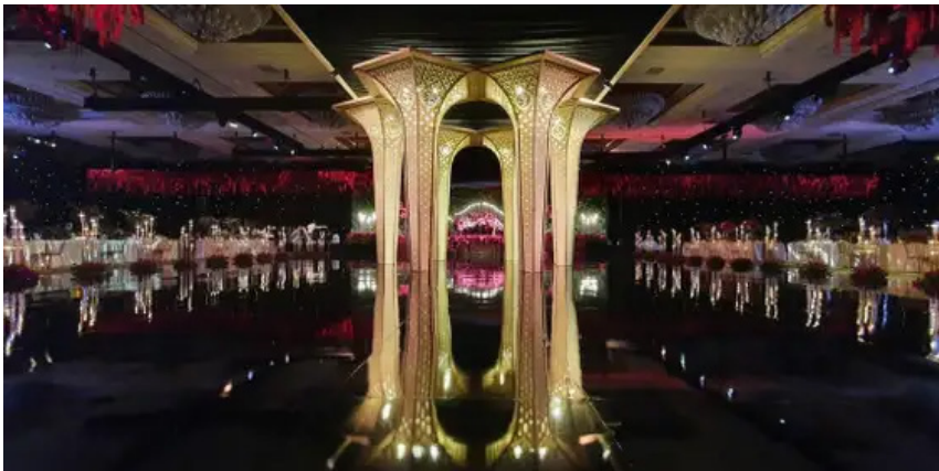
Gambar 3 Contoh Hasil Dekorasi Indoor dari Lotus.design