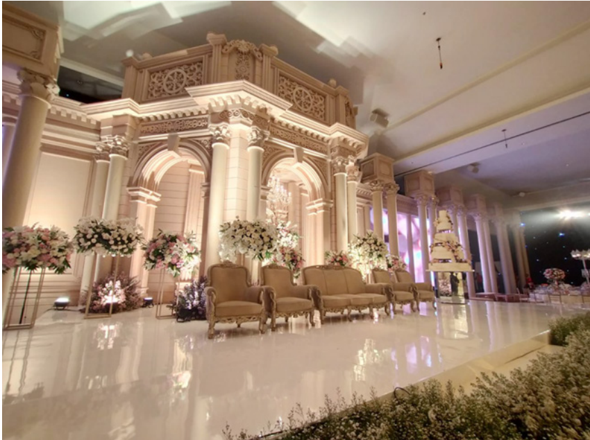
Gambar 2 Contoh hasil Dekorasi indoor dari Lotus.design

Di bawah ini adalah beberapa contoh hasil desain dari Lotus design yang diambil dari berbagai sumber yaitu bridestory.com (2021) dan juga Instagram Bapak Li Su Wen @limsuwen.