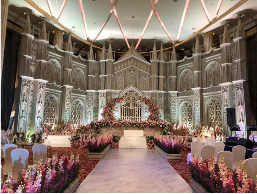
Gambar 4 Desain dengan Tema Gereja