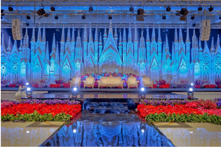
Gambar 6 Desain dengan Tema Kerajaan

Profesionalisme Kewirausahaan menurut Bapak Lim Su Wen tidak bisa datang dengan sendirinya, harus mau diasah mau belajar yang menunjukkan profesionalismenya. Profesionalisme bukan kita yang menentukan tapi sekeliling kita yang menentukan kita professional, dan orang percaya akan karya dan profesi kita.