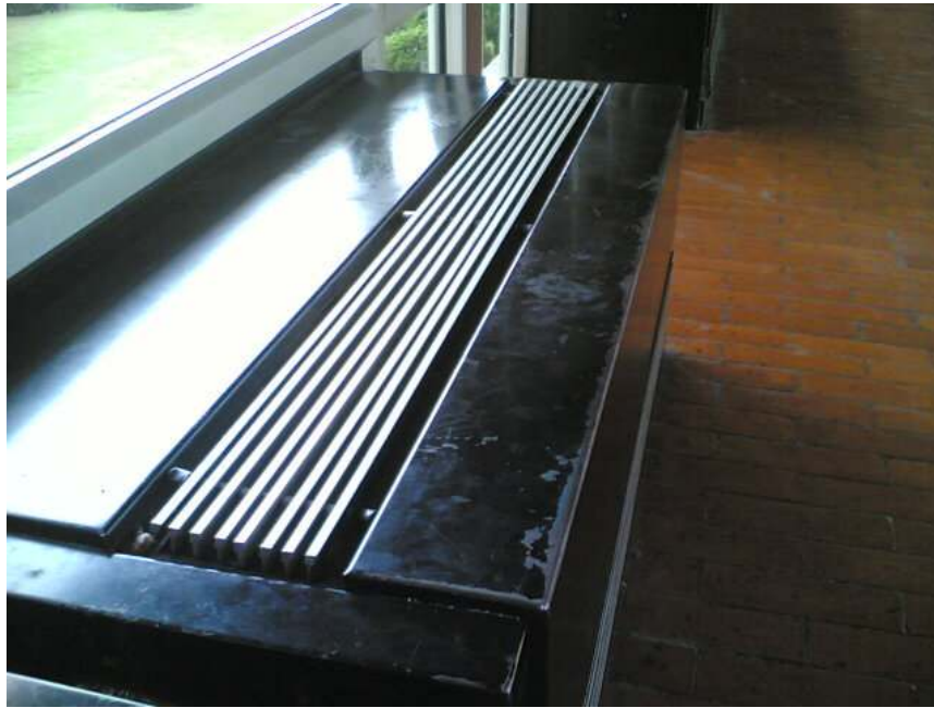
Gambar 3.5 Air conditioner (AC)