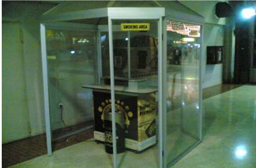
Gambar 3.1 Ruangan merokok( Smoking Room )