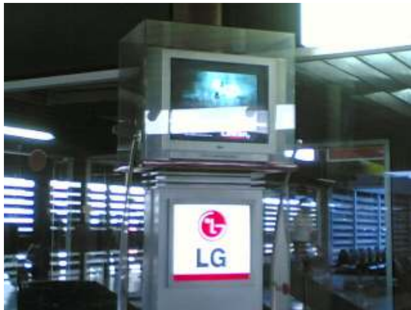
Gambar 3.6 Sarana hiburan (TV)