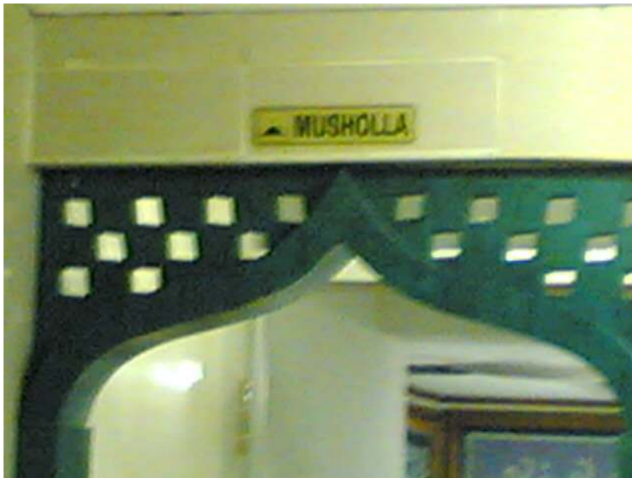
Gambar 3.4 Musholla