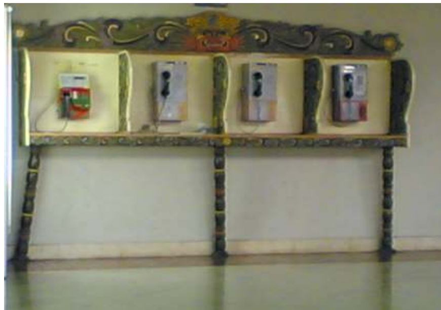
Gambar 3.2 Telepon umum