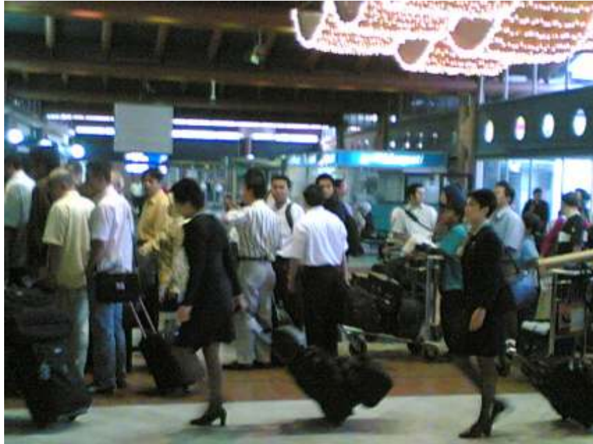
Gambar 4.1 Kesibukan di terminal keberangkatan Internasional