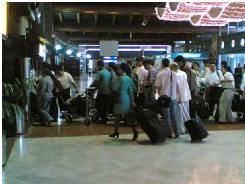
Gambar 4.2 Kesibukan di terminal keberangkatan Internasional