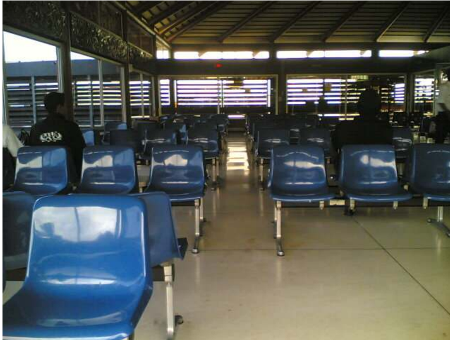
Gambar 3.3 Ruang tunggu keberangkatan