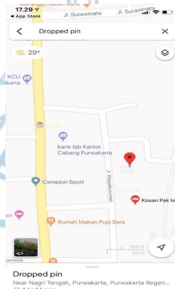
Gambar 1.5 Google Maps J Court & Store

J Court & Store beralamat di Jalan Wijaya Kusuma No. 16, Purwakarta, Jawa Barat 4111, Indonesia. Alamat tersebut menjadi kantor sekaligus tempat penyewaan J Court & Store , lokasi ini dipilih karena berada di pusat kota yang strategis dan dekat dengan Toko Champion Sport , Universitas Pendidikan Indonesia Purwakarta, SMAN 1 Purwakarta, SMAN 2 Purwakarta, SMA Pasundan, SMKN 3 Purwakarta, dan juga lokasi tersebut menjadi mudah untuk di temukan.