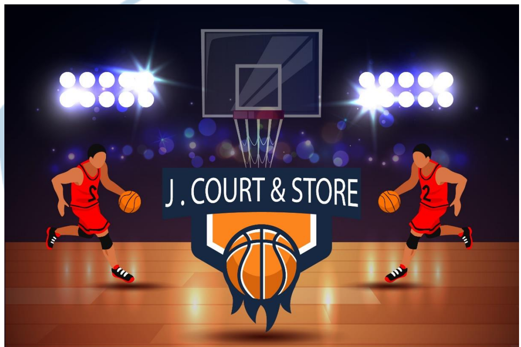
Gambar 1.4 Logo J Court & Store

kapasitas tempat duduk untuk penonton dan lantai lapangan yang berbahan parket berkualitas premium. Keunikan yang kami berikan disini berupa lapangan basket yang berkualitas premium dalam penggunaan alat dan keperluan lainnya yang menunjang untuk olahraga basket dan kepuasan konsumen yaitu menggunakan scorerboard digital , papan ring akrilik, lantai lapangan berbahan parket , terdapat toko yang menjual berbagai alat olahraga, toilet yang bersih dan lapangan parkir yang luas.