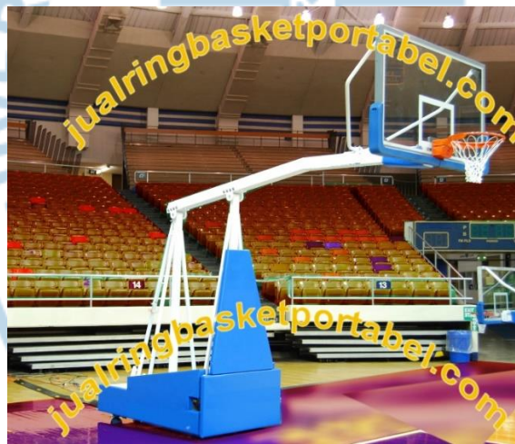
Gambar 1.3 Papan/ring basket model BSP-0608

Lalu J Court juga memiliki papan/ring basket yang standar untuk turnamen resmi di Indonesia seperti PERBASI (Persatuan Bola Basket Seluruh Indonesia) yaitu dengan model BSP-0608 ( http://jualringbasketportabel.com , 1 November 2019).