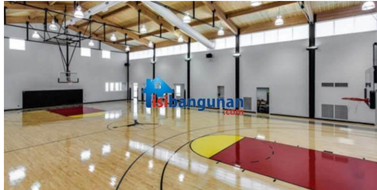
Gambar 1.2 Lapangan dengan material Parket

Lalu J Court juga memiliki papan/ring basket yang standar untuk turnamen resmi di Indonesia seperti PERBASI (Persatuan Bola Basket Seluruh Indonesia) yaitu dengan model BSP-0608 ( http://jualringbasketportabel.com , 1 November 2019).