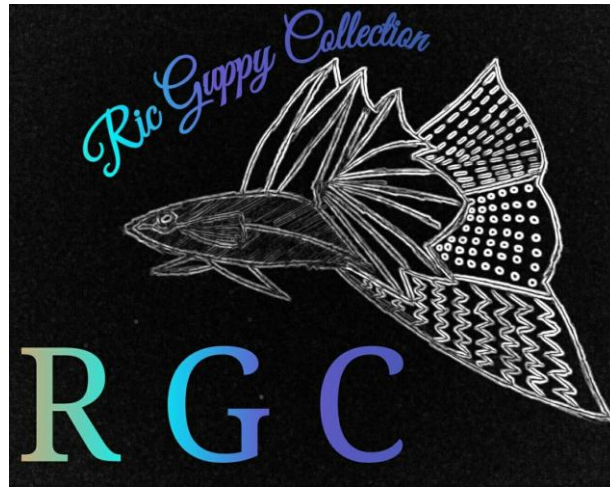
Gambar 1.3 Logo Ric Guppy Collection

Berikut ini merupakan logo dan arti logo Ric Guppy Collection :