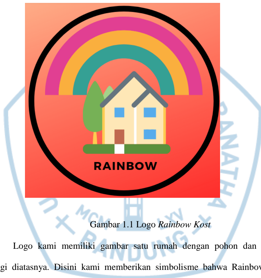
Gambar 1.1 Logo Rainbow Kost

Rainbow Kost adalah nama yang dipilih karena rainbow dalam bahasa Inggris berarti ‘pelangi’. Keberadaan kata ‘pelangi’ ini menunjukkan “banyak warna” pada rumah kost kami, yang berasal dari ekspresi tiap penghuni dalam menata kamar. Logo yang kami miliki sebagai berikut: