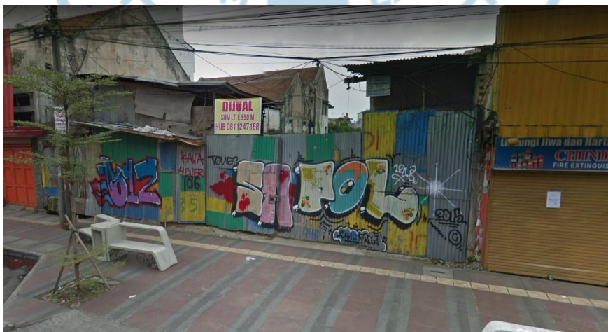
Gambar 1.3 Lokasi Bengkel

Berikut tempat yang akan dibangun bengkel: