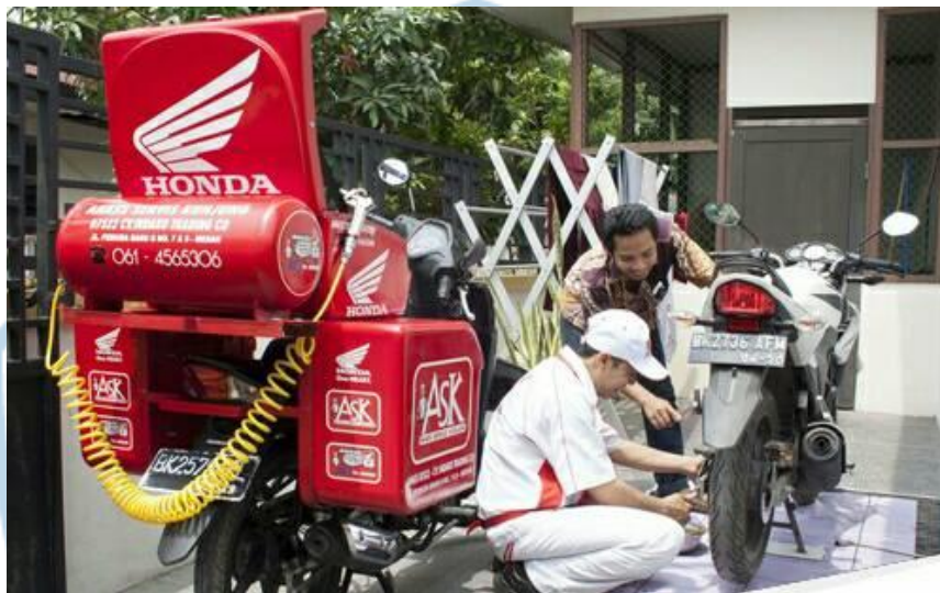
Gambar 1.1 Home Service

Jasa home service adalah jasa pemanggilan montir jika konsumen mengalami kendala/ mogok di tengah jalan. Konsumen dapat menghubungi bengkel J.W Motor dan montir akan datang ke tempat konsumen. Biaya yang diberikan untuk jasa pemanggilan montir adalah Rp50.000 (di luar biaya servis).