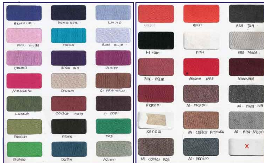
Gambar 1.1 Contoh Warna yang Dijual

Berikut contoh warna kain Trading tekstil KSP yang ditawarkan kepada konsumen maupun calon konsumen.